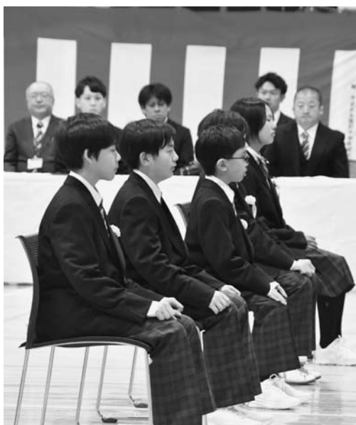
陸別中学校入学式

今年の陸別保育所入所式が4月4日に同保育所で行われ、1歳児「ひよこ組」が1名、2・3歳児「ぼんだ組」が6名の計7名が入所しました。また、4月8日には陸別小学校、陸別中学校でそれぞれ入学式が行われ、小学校10名、中学校5名の新1年生が入学し、在校生に温かく迎えられました。