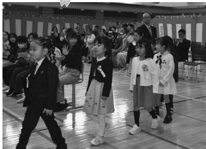
陸別小学校入学式