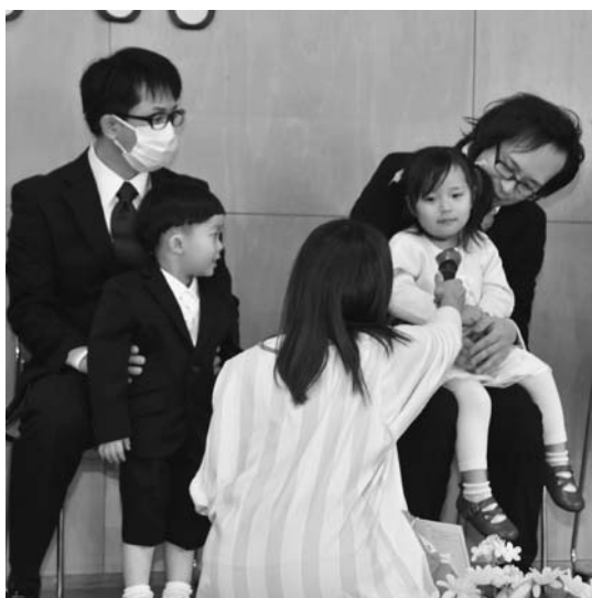
陸別保育所入所式