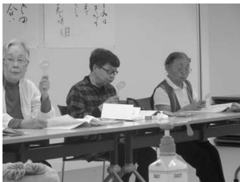
↓「お口の健康講座」での実践