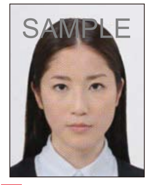
★ ドットやインクのにじ みなどがあるもの

デジタル印刷の場合、ドット(網状の点)やジャギー(階段状のギザギザ模様)、インクのにじみなどがみられるものは不適当です。写真専用紙等を使用し、鮮明な画質で印刷してください。