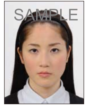
● 顔の器官を隠さず、 小ぶりなもの

眼鏡やヘアバンド以外にも、帽子や衣服、布、マスク、イアリング、カチューシャなど顔の器官が隠れるような大きめの装飾品等は好ましくありません。 なお、顔の器官を隠さず髪を上げるため等の小ぶりな装飾品は受理しますが、着ける箇所によっては不適当となる場合があります。大きさ等の判断に迷う場合は装飾品をはずした写真をお持ちください。