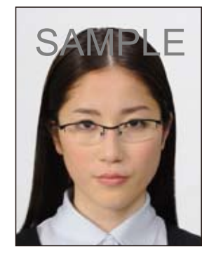
★ 眼鏡のフレームが目に かかっているもの

今後、出入国審査等で旅券に内蔵されている IC チップに記録された 顔画像とその旅券を提示した人物の顔を電子機器等で照合することが 見込まれ、眼鏡のフレームや照明の反射が目にかかっているものやフ レームが非常に太いものなどは、照合の妨げとなる可能性がありますの で注意が必要です。