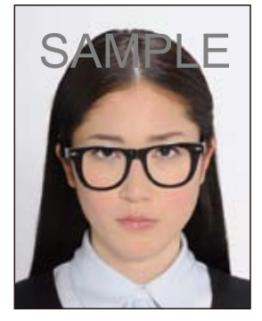
▼ フレームが非常に太く 目や顔を覆う面積の 大きいもの