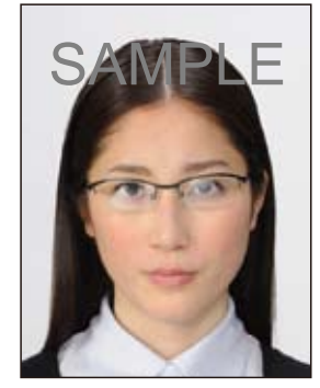
_____ 照明が眼鏡に反射し たもの

撮影時にピントが合っていなかったり、手ブレしてしまったために画像が不鮮明なものや 背景に人物の影があるものは不適当です。