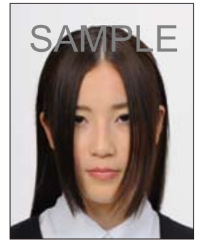
前髪が長すぎて目元が 見えないもの 顔の輪郭が隠れるもの