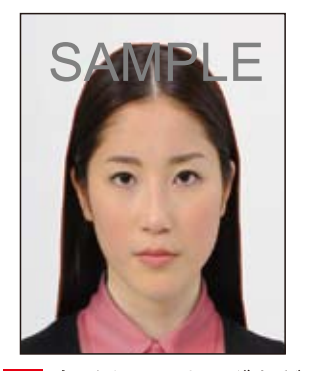
※ 変形やマスキングなど の画像処理を施した もの

頭髪のボリュームが極端に大きな場合には、 下図に示すように「両眼の中心から頭頂まで の距離」は「両眼の中心から顎までの距離」 と等しいものとみなして、トリミングしてくだ さい。 4+2