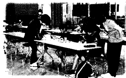
夏のがんばルームの様子

目的 陸別町の教育行政執行方針理念「陸別の子は陸別で育てる」の観点から、陸別町地域在住(出身)の若者に、学習習慣の定着及び学力の向上に資することを目的とした長期休業中の学習支援ボランティアを募集します。学校の教育活動をお手伝いいただくことにより、学校教育の一層の多様化・活性化を図ります。