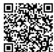
二次元バーコード

電子申請アドレス https://www.harp.lg.jp/rZQZdS3d