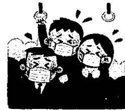
混雑した乗り物の中