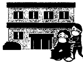
高齢者施設など に行くとき