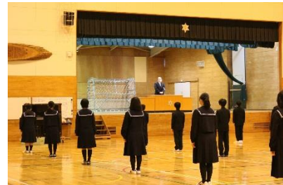
生徒会を代表して挨拶

きょうから3学期が始まります。皆さんご存じのようにコロナウイルスの影響はこれからもどうなるか想像できない状況です。これまでも工夫して学校生活にあたってきましたが、今後も、皆さん一人一人の協力が欠かせません。去年皆さんは、いろいろな経験を通して成長しています。各個人が自覚していることと思いますが自分の成長をさらに確実にするために、一日一日の積み重ねを大切にしてほしいと思います。その積み重ねが次の学年や次のステージにつながります。特に3年生は日々の積み重ねが夢の実現や次の生活に生きています。毎日を大切に過ごす充実した三学期となることを期待しています。