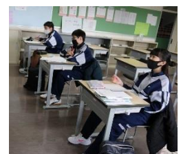
冬休み中の学習サポートの様子。延べ24人が参加