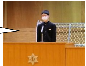
各学年を代表して挨拶（3名）