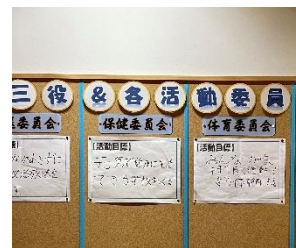
【各委員会の活動目標】