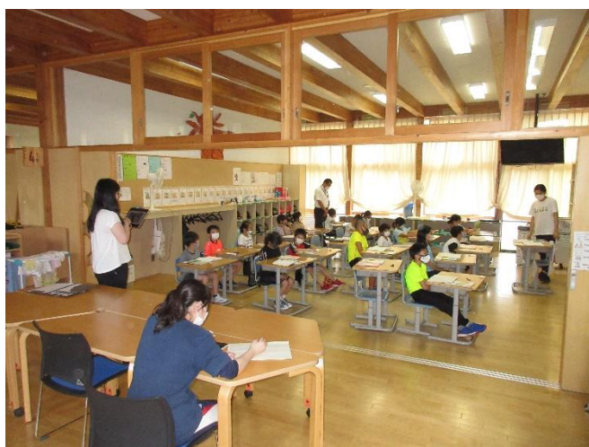
渋谷学級十勝教育局出前授業（3年生国語の授業）