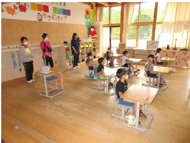
保小連携授業（1年生の授業参観）

1学期は，コロナ禍の中で子どもたちも先生方もそして保護者の皆様方も本当によく頑張って学校生活や日常生活を送ってきました。私は，学校行事やPTA活動等が十分に展開されることができなかったことに残念な思いと申し訳ない気持ちでいっぱいです。2学期には，学校生活を通して頭も心も身体も元気になることが，小学生