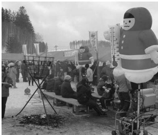
▷一夜明けてぐったり