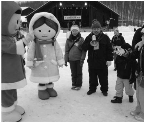
▷B★Bもラジオ体操指導