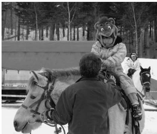
▷4000人目の参加者に記念品