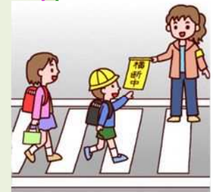
登下校の見守り活動