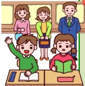
開かれた学校づくり