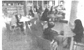
【縦割り勉強会の様子】