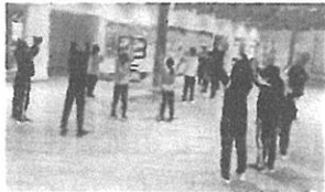
【朝のマッスル運動の様子】

児童会では、自由参加の体を動かすマッスル運動や、縦割り勉強会など、創意工夫した取組を計画して実施しています。これらの活動はよりよい学校を創るために児童会が考えた取組です。こうした取組を通して、学年の枠を超えた交流が盛んになり、人とかかわり方や集団活動をする上で大切なことを身に付けていけると思っております。