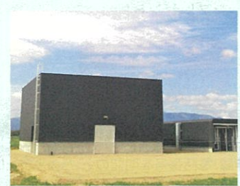
ホワイトデータセンター

美唄自然エネルギー研究会は産学官の団体で、雪を資源として生かすための調査研究や開発普及を行っています。10年以上をかけて取り組んできた「ホワイトデータセンター」構想は、大量の電力を必要とするデータセンターの冷房に、雪の冷熱エネルギーを利用するしくみです。データセンターの多くは首都圏にありますが、美唄市に誘致することにより、サーバーの冷却費用の大幅な削減が可能です。 2010年から実証実験を重ねてきた結果、商用化が可能になり、共同研究体の1社が2020年、美唄市で事業を開始。ことし4月に「株式会社ホワイトデータセンター」が創業しました。道路排雪による雪冷熱をデータセンターの冷房に使えば、サーバーからの排熱を、ウナギやアワビなどの陸上養殖施設やトマトなどの植物工場の空調に活用しています。さらに、地産地消型の再生可能エネルギーの発電事業によって温室効果ガス排出ゼロを目指しています。