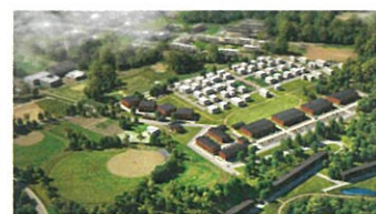
環境配慮型街区の完成イメージ

ニセコ町は国の「SDGs 未来都市」に選ばれ、町では温室効果ガスの排出量を2050年までに実質ゼロにする目標を掲げています。現在進められている第2次ニセコ町環境モデル都市アクションプランでは、2019年からの5年間で、温室効果ガスの削減に取り組むだけでなく、地域課題を解決し、より良い暮らしを形づくることを目指しています。