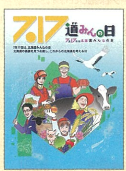
「北海道みんなの日」ポスターとチラシのイラスト

7月17日は「北海道みんなの日」です。北海道の歴史や文化、豊かな自然風土など、北海道の価値を見つめ直し、誇りに思う心を育み、より豊かな北海道を築き上げることを期する日として、2017年に制定しました。 道では、「北海道みんなの日」を記念し、この日を中心に道内各地域でさまざまな取り組みを行います。詳しくは道のウェブサイトをご覧ください。