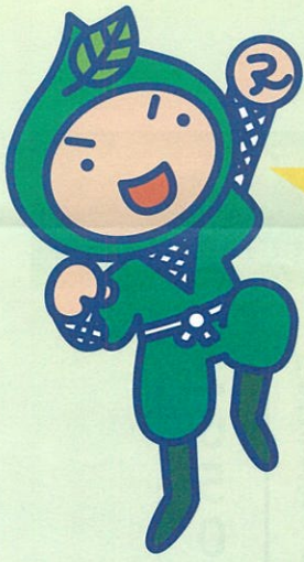
環境忍者 えこ之助

●特集に関するお問い合わせ/道庁気候変動対策課 TEL.011-204-5334