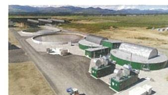
有限会社ドリームヒルのバイオガスプラント

そこで、町内農業関係機関で調査研究を進め、その後、酪農・畜産農家や農協などが出資するバイオガスプラント運営会社を設立し、2017年からバイオガスプラントの整備に着手しました。また、同年には道の支援を受け、