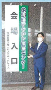
北海道ワクチン接種センター

道は、新型コロナウイルス感染症の感染拡大防止を図るため、ワクチン接種を希望する道民の皆さんが、安心して円滑に接種を受けていただけるよう、石狩管内 ※ を対象とする北海道ワクチン接種センターを設置するなど、市町村と一緒に接種体制の整備に取り組んでいます。