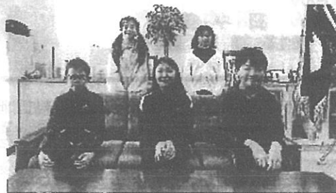
【前期児童会役員の皆さん。素敵な学校づくりを！】

15日は児童会の活動委員会が行われました。来月行われる児童総会に向けて、委員会ごとに前期の目標や活動内容について話し合いがもたれました。自分たちでよりよい陸別小学校をつくるための大切な活動です。児童会役員の皆さんを中心に全校で協力して盛り上げていきましょう！