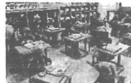
【1年生初めての給食の様子】

新学期が始まって1か月、特に1年生は新しい環境での生活にとっても疲れたと思います。明日から5連休になります。各ご家庭では、子ども達にこの1か月の学校生活の様子を聞いていただき、その頑張りを大いに褒めていただければと思います。この5連休で、またしっかりエネルギーを貯めて、連休明けに元気に登校してくるのを心待ちにしております。