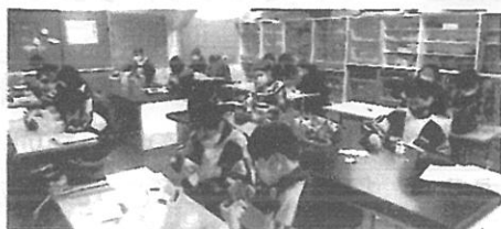
後ろの方で保護者も一緒に実験中

例年、12月の土曜授業で参観日を実施していましたが、今年度は、12月に延期した文化祭に合わせ、また、感染対策として学年を分けて9日(水)～11日(金)の3日間で行いました。参観に際しては、再び新型コロナウイルス感染拡大を受けて授業会場を体育館とするなどの対策をとりながら実施しました。