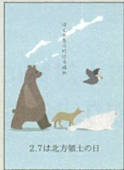
2.7は北方領土の日 昨年の最優秀作品(総合)

2月7日は「北方領土の日」です。この日を広く知ってもらい、北方領土への関心を高めてもらうためのポスターや作文のコンテストを実施します。ぜひ、ご応募ください。