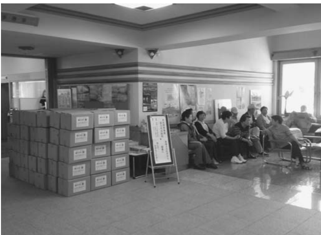
7/5 平成24年度から27年度に町が試験製造した木炭が「町民還元木炭」として配布されました。配布開始前から30人以上が配布場所の役場庁舎1階ロビーに集まり、準備していた100個は即日配布を完了しました。