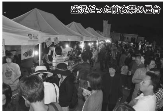
盛況だった前夜祭の屋台