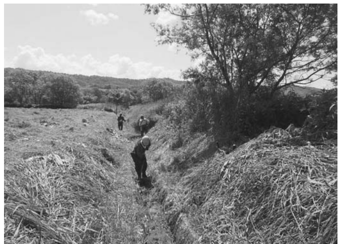
6/29 榑石橋建設が社会貢献活動の一環として、農地・農業用水の保全活動を行いました。この活動は平成24年から継続して実施しており、同社社員3人が1日かけて明渠排水路500mの草刈りを行いました。