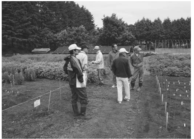
7/6 薬用植物町民見学会が農畜産物加工研修センターで行われました。この見学会は町が実施したもので、8人が参加。担当者が圃場を案内しながら薬用植物研究事業の状況と栽培中の薬用植物の解説を行いました。