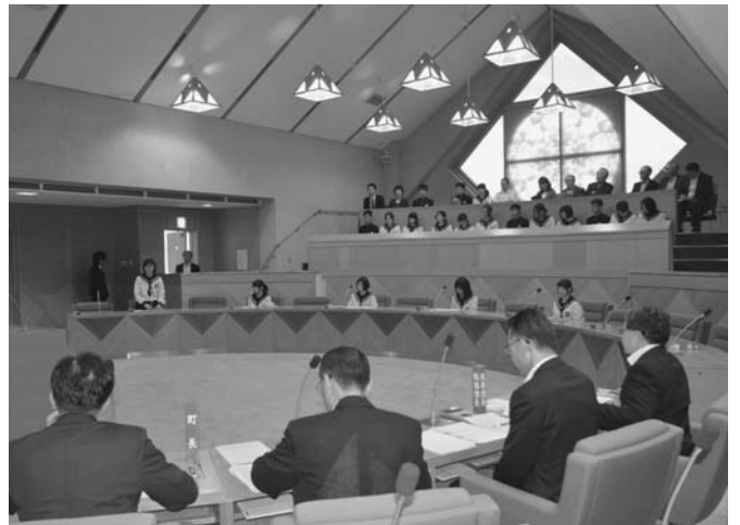
6/27 陸別中学校の全学年が議会議場で模擬議会を行いました。この模擬議会は地域について関心を高めることを目的としたもので、各学年ごとに代表者が質問に立ち、町長や担当者が本番さながらの答弁を行いました。