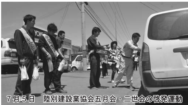
7月5日 陸別建設業協会五月会・二世会の啓発運動