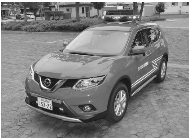
7/11 陸別消防署に新しい指揮車が納車となり、この日、お披露目となりました。この指揮車は、日産エクストレイルがベース車両となっており、ハイブリットエンジンを搭載した四輪駆動車となっています。