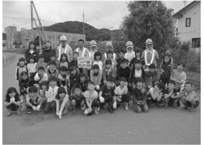
6/22 陸別町商工会が参画するイエローリボンプロジェクトに係るひまわりの種まきが行われ、陸別小1・2年生が参加しました。この取り組みには毎年、榑石橋建設が地域貢献活動の一環として協力し、同社社員が児童に種まきを指導しました。