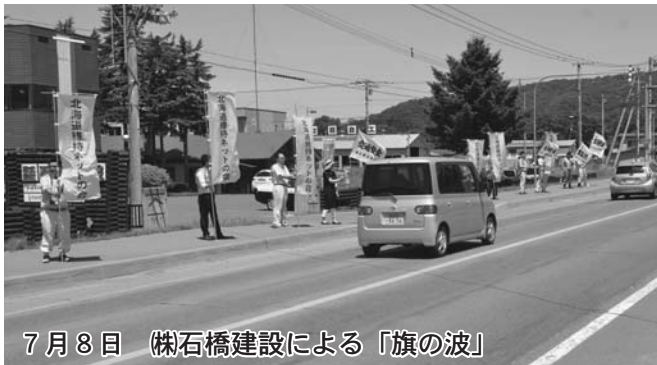
7月8日 ㈱石橋建設による「旗の波」