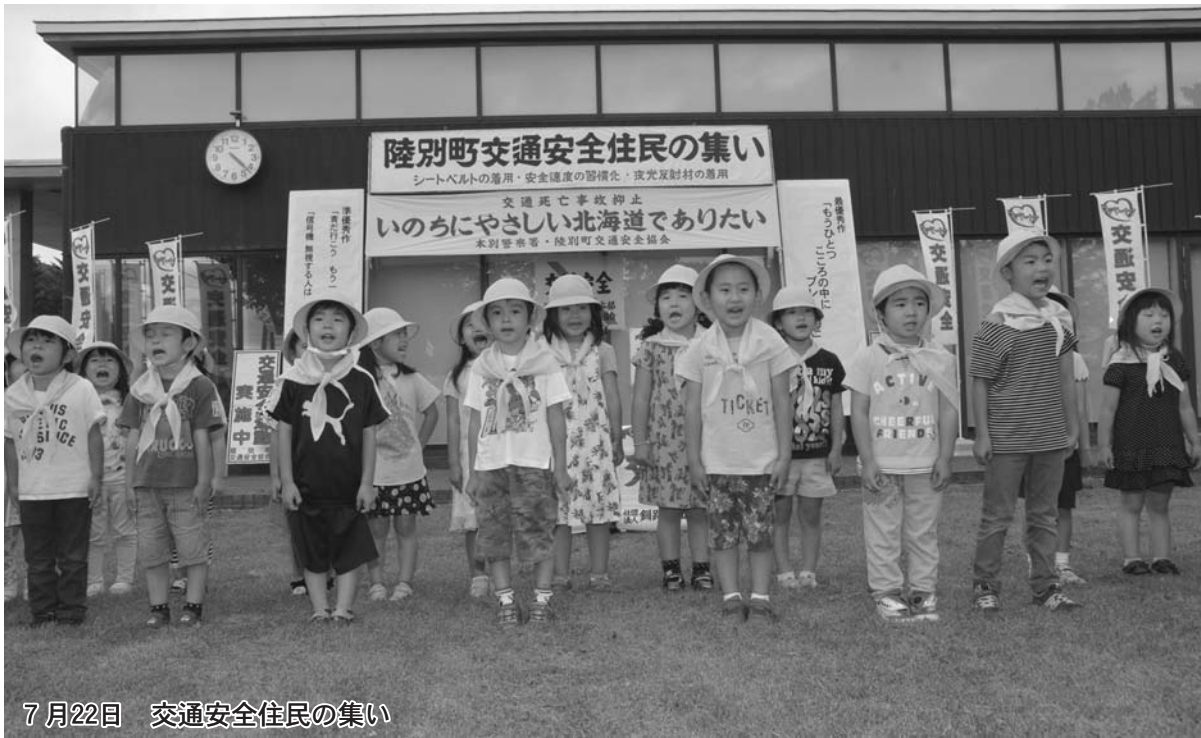
7月22日 交通安全住民の集い