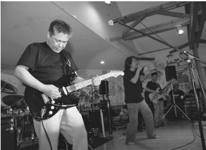
7/2 今回で10回目となる、しばれロックフェスティバルが開催されました。激しい雨のため会場をイベントセンター内に移動する事態となりましたが、来場者はゲスト2バンドを含む全11バンドの演奏を楽しみました。