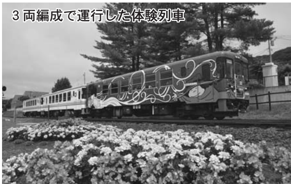
3両編成で運行した体験列車

7月23日・24日 今年で8回目の開催となった、ふるさと銀河線りくべつ鉄道まつりが今年も前夜祭と本祭の2日間の日程で開催されました。 2日間で延べ4000人が来場し、花火やステージショー、各アトラクションを楽しみました。 2日間の様子を写真で振り返ります。