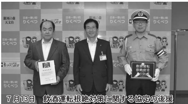
7月13日 飲酒運転根絶対策に関する協定の後援