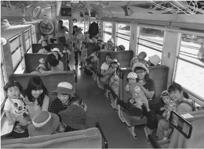
6/29 育児サークル「らっこクラブ」のメンバーがりくくべつ鉄道に体験乗車しました。参加した保護者と子供36人は、車窓からの景色を眺めながら、駅構内を15分ほど往復する列車の旅を楽しみました。