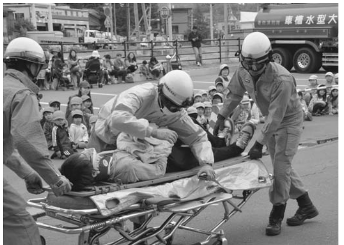
7/6 陸別保育所園児を対象とした、ちびっこ防火フェスティバルが陸別消防庁舎前で行われました。園児は放水訓練を体験した後、署員による車両事故での救出訓練を見学。緊迫した救出の状況を見学していました。