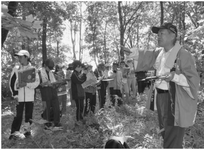
7/9 陸別小学校の土曜授業が宮の森風景林で行われました。同小学校では初となる土曜授業は、十勝東部森林管理署職員が講師を務め、低・中・高学年のグループごとに遊歩道で自然と森林の成り立ちを学びました。