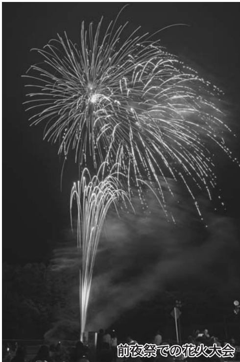
前夜祭での花火大会