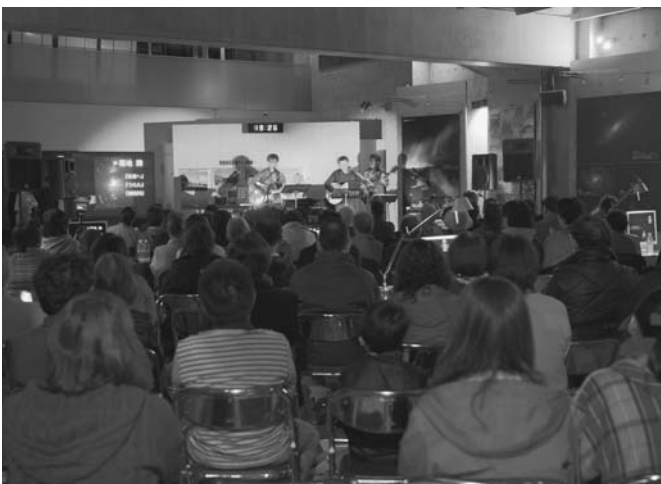
4/23 町民星空コンサートが銀河の森天文台で開催されました。今回は、町内で活動するバックヤードミュージックギタークラブの皆さんが出演。熱のこもった演奏を来場した120人が楽しみました。