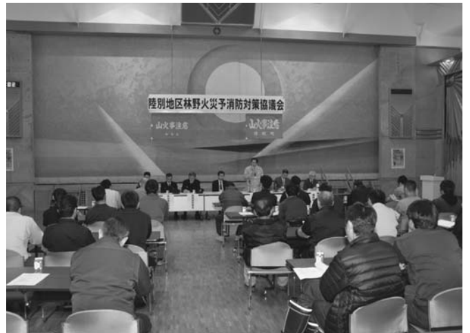
4/5 平成28年度陸別地区林野火災予消防対策協議会がタウンホールで開かれ、50人が出席しました。同協議会は関係機関や企業が連携し、林野火災の対策を協議する場として毎年開催されています。