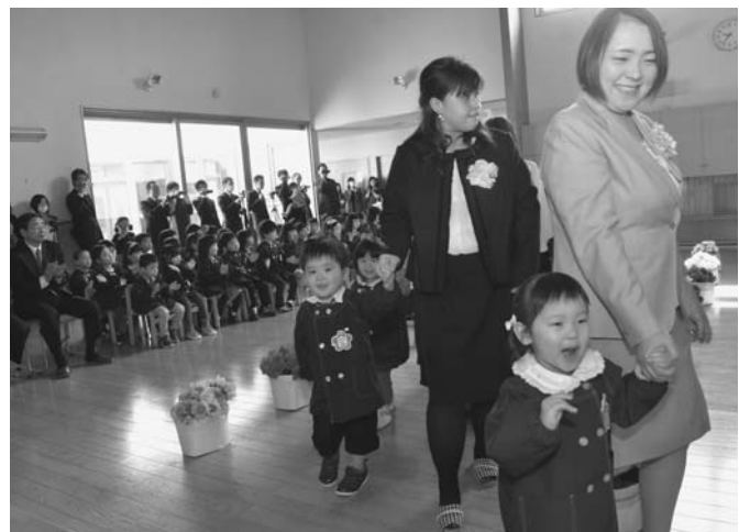
4/7 陸別保育所の平成28年度入所式が行われ、ひよこ組に2人、うさぎ組に16人が新たに入所しました。園児は、保護者と手をつないで元気に入場。在園児や出席者は、暖かい拍手で歓迎しました。