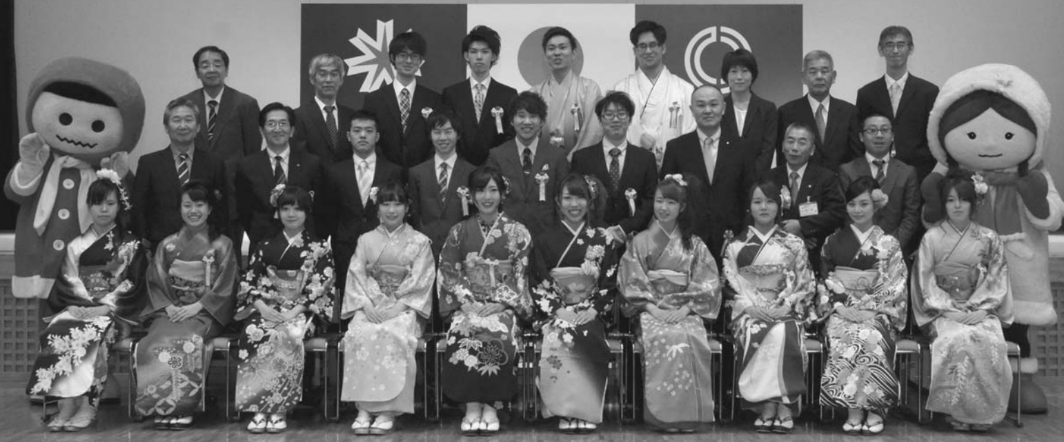
新成人と関係者による記念撮影