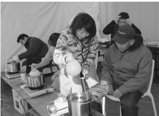
1/15・16 ろうを溶かして作る「ワックスボール」づくりがコミュニティプラザ☆ぷらっと前で行われました。ボランティア約50人の手により70個が完成し、しばれフェスティバル会場の記念撮影スポットで使用されます。