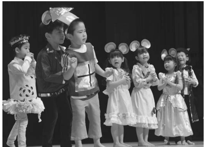
12/13 陸別保育所の生活発表会がタウンホールで行われました。各クラスごとにゆうぎや舞踊劇、歌をステージの上で力いっぱい披露しました。（写真は、きりん組による舞踊劇「ねずみの嫁入り」）