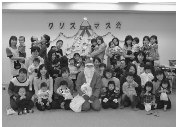
12/15 育児サークル「らっこクラブ」によるクリスマス会が保健センターで行われました。参加した18組の親子はリースづくりやゲームを楽しみ、子供達はサンタクロースからプレゼントをもらいました。