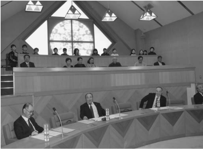
12/17 陸小6年生12人が町議会を見学しました。児童らはこの日に行われていた12月定例会の本会議を傍聴。町議会議員からの一般質問に町長が答える様子を肌で感じ、町議会の重要性について学びました。