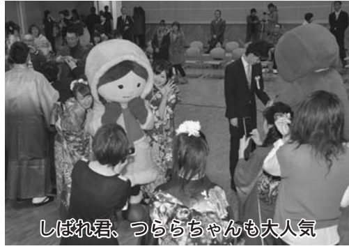
しばれ君、つらちゃんも大人気

分自身で考えて行動し、責任を負わなければならない。社会人としての常識を大切に社会という大海へ胸を張って船出したい」と成人の決意を語りました。