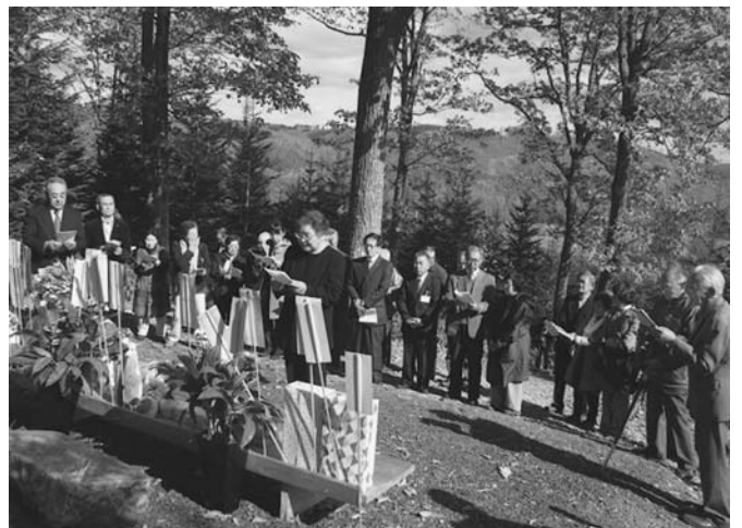
10/15 陸別開拓の祖・関寛斎の命日祭「白里忌」が町内関の「寛斎の丘」で行われました。没後103年となる今回は30人が参列。参列者は辞世の歌などを詠み、献花を行ってその生涯と功績をしのびました。