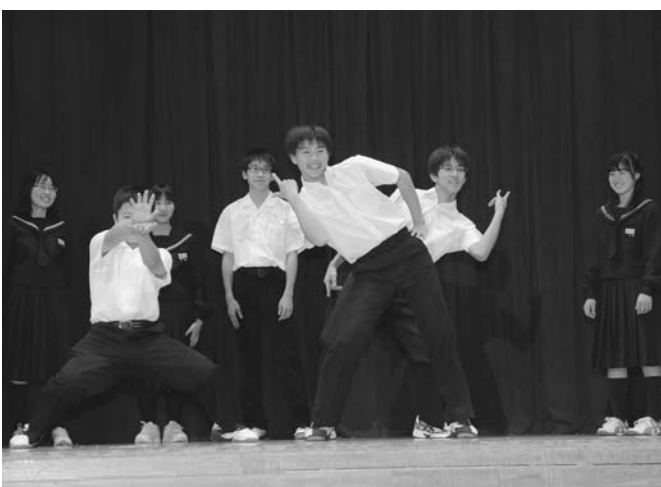
10/25 陸別中学校文化祭が行われました。恒例のクラス発表では、1年生による影絵「大きな木」、2年生はストーリーを取り入れたダンス、3年生は寸劇にダンスやバンド演奏を加えるなど趣向を凝らした発表を披露しました。