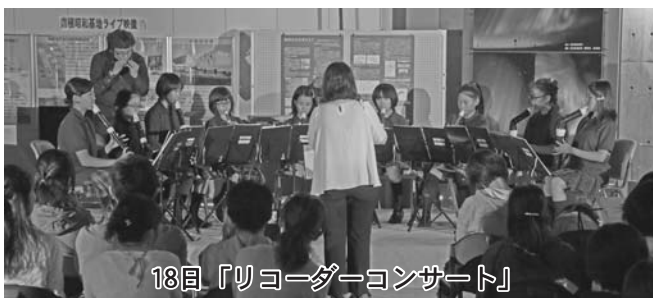
18日「リコーダーコンサート」