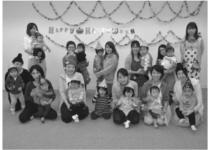
10/6 育児サークルらっこクラブによるハロウィンパーティーが保健センターで開催され、23人が参加しました。子供達は親子で作った帽子などで仮装し、パレードしながらお菓子のプレゼントをもらい楽しみました。