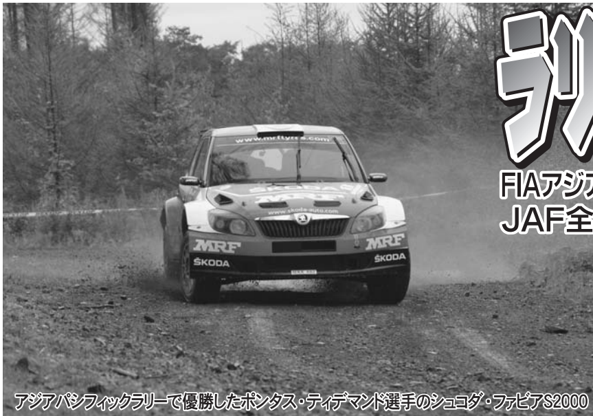
アジアパシフィックラリーで優勝したポンス・ティデマン選手のシュコダ・ファビアS2000

FIAアジア・パシフィックラリー選手権 第5戦 JAF全日本ラリー選手権 第7戦