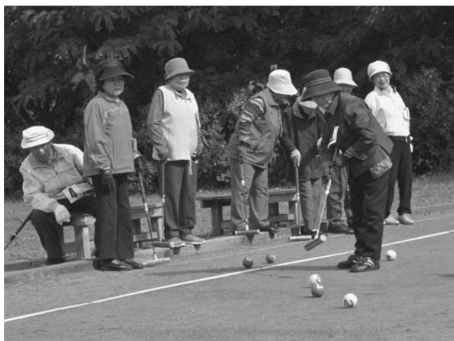
接戦となった藤田チームと長屋チームの試合