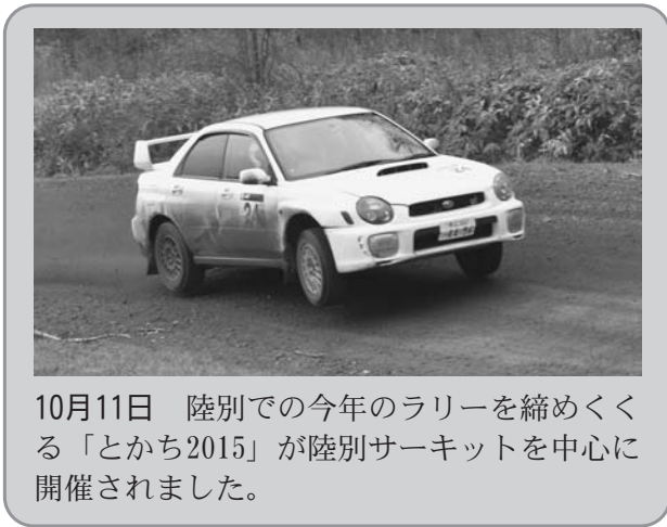
10月11日 陸別での今年のラリーを締めくくる「とちち2015」が陸別サーキットを中心に開催されました。

国内唯一の国際ラリー大会であるラリー北海道が今年も十勝管内6市町村を舞台に9月18日から20日の日程で開催されました。9月19日は、陸別を中心に競技が行われ、雨天にも関わらず多くのラリーファンが観戦エリアのある陸別サーキットや銀河の森周辺で迫力のレースを楽しみました。