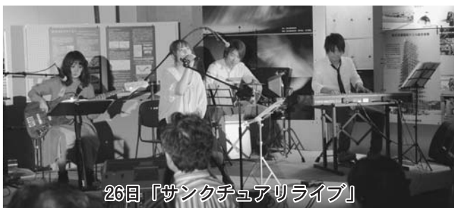
26日「サンクチュアリライブ」