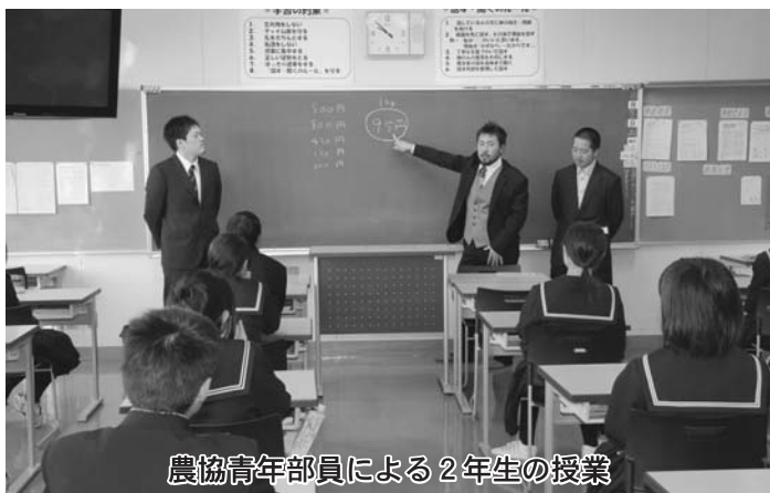
農協青年部員による2年生の授業

この土曜授業は全10回が行われ、最終回の来年2月27日には地域の人材を活用した授業も予定されています。