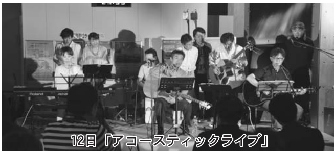
12日「アコースティックライブ」

3回目の26日は、札幌市を中心に活動している「サンクチュアリ」のライブが行われ、オリジナル曲や星にちなんだカバー曲を演奏しました。