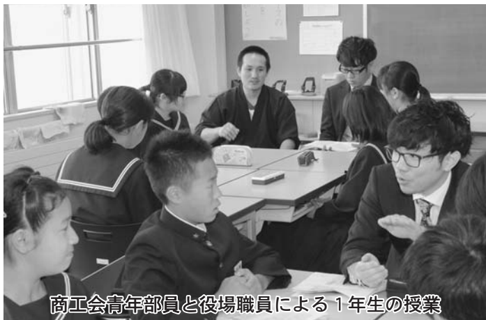
商工会青年部員と役場職員による1年生の授業