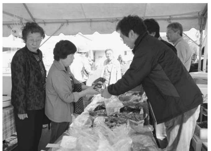
10/17 秋の味覚祭り(陸別町商工会主催)がコミュニティプラザ☆びらっと駐車場で行われました。会場では野菜や海鮮など旬の食材、温かい三平汁やイモもちが販売され、多くの家族連れなどで賑わいました。