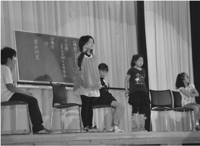
10/18 陸別小学校学習発表会が行われました。発表会は恒例の1年生のあいさつ「口上」から始まり、各学年が練習の成果を披露。児童の姿に会場からは大きな拍手が送られました。(写真は6年生劇「戦いの構造」)