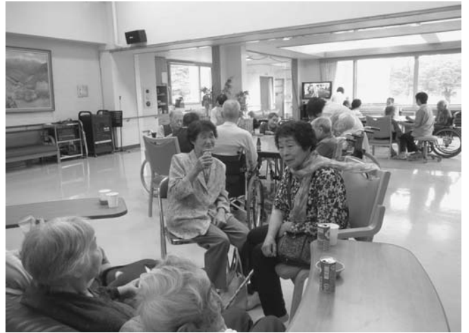
7/22 介護を支える会（地域包括支援センター）による「ほっとカフェ」が、しらかば苑で行われました。参加した入所者ら約50人は、お茶会を楽しみながらバラの切り絵を作成するなど楽しいひと時を過ごしました。