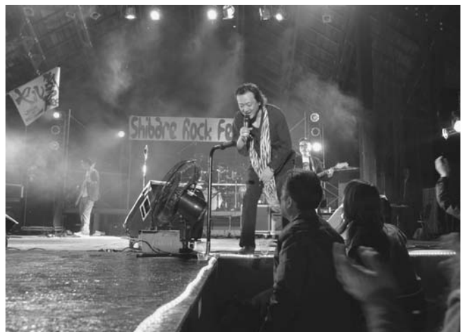
7/4 今回で9回目となる、しばれロックフェスティバルがイベントセンターで行われました。時折雨が降る天候となりましたが、来場者は道内各地から集まった11バンドの様々な演奏を楽しみました。