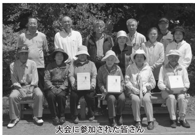
大会に参加された皆さん