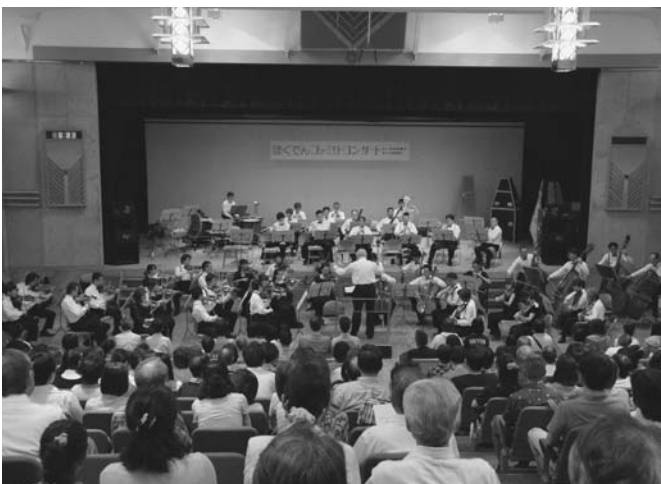
7/17 ほくでんファミリーコンサートがタウンホールで開かれました。陸別では18年ぶりとなる札幌交響楽団の織細で迫力ある演奏は集まった約320人を魅了。演奏後は大きな拍手が会場に響きました。