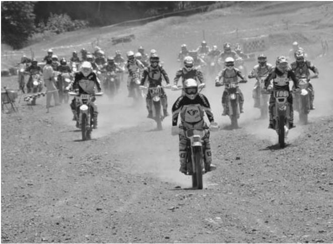
7/5 オートバイのラリー「陸別クロスカントリー」が陸別サーキット周辺で行われました。参加者33人は、所々ぬかるんだ1周約8kmのコースに悪戦苦闘しながらも果敢にアクセルを開けていました。