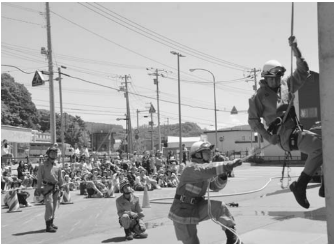
7/9 ちびっこ防火フェスティバルが、陸別消防庁舎前で行了されました。参加した陸別保育所園児は、放水訓練や消防車の体験乗車を楽しみ、消防署員による本番さながらの緊迫した消火訓練を見学しました。