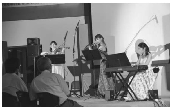
草野完也教授による講演会（写真上）と「奏楽（そら）」によるコンサート（写真下）