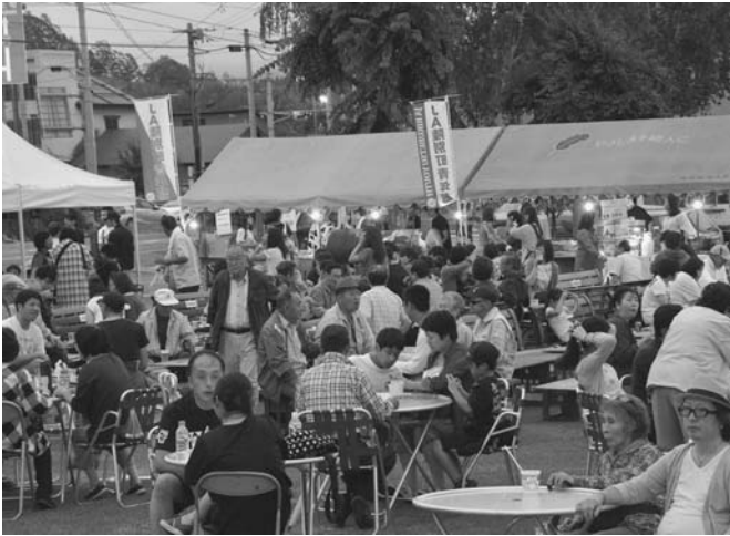
7/25 第12回屋台村（陸別町商工会青年部主催）が駅前多目的広場で行われました。会場には、13件の屋台が軒を連ね、来場者は飲み物を片手に各屋台の自慢の料理を味わいながら夏の一夜を楽しみました。