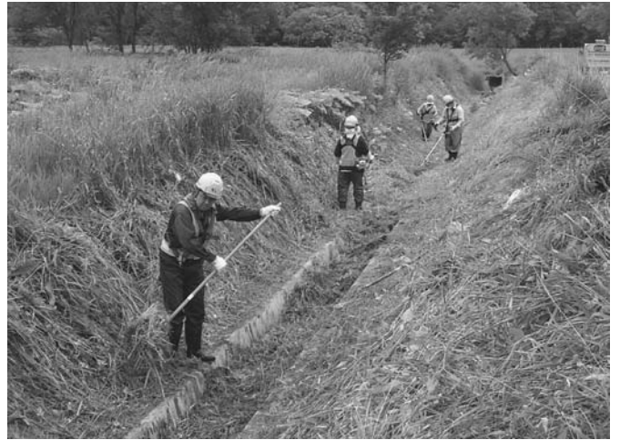
6/23 橋石橋建設による農地・農業用水の保全活動が行われました。この活動は、社会貢献の一環として平成24年から継続しているもので、社員4名が明渠排水路約500mの草刈りや雑木の伐採に汗を流しました。