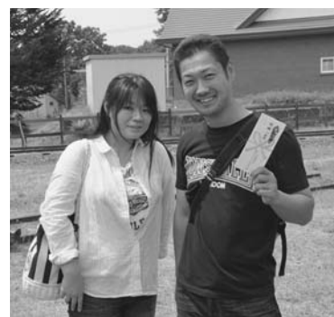
▶「転車でGo!」の優勝は、奈良県から新婚旅行で訪れたご夫婦（19日）