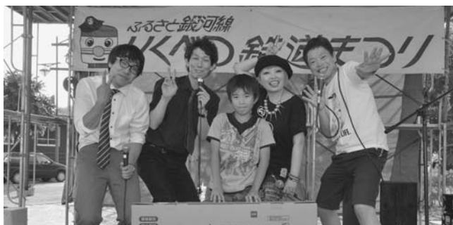
▶抽選会の特賞は、札幌市から来ていただいた方（19日）