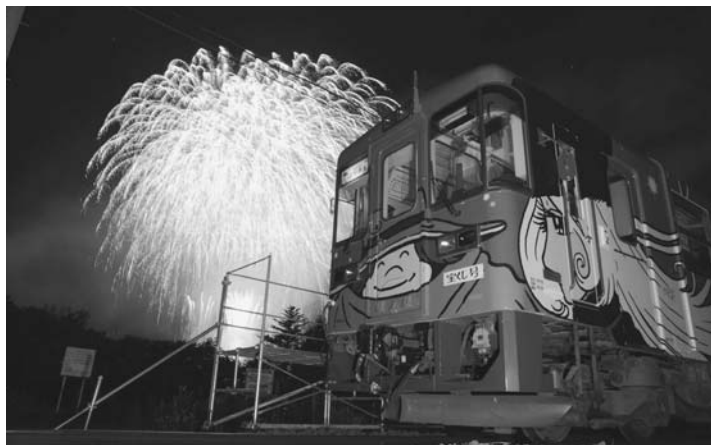
▶1500発打ち上げられた 花火大会（18日）

また、19日は駅構内や駅前多目的広場を会場に体験乗車や歌謡・お笑いショーなど様々な催しが行われ、来場者3500人が2日間に渡り夏の陸別を堪能しました。