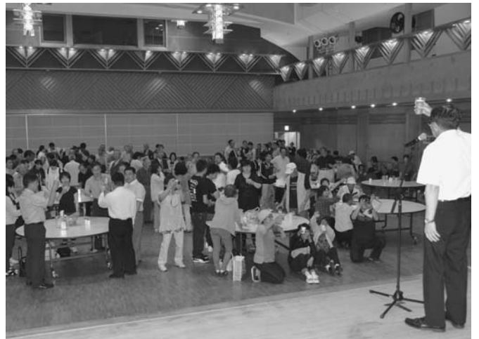
7/3 ふれあいビールまつり（社会福祉協議会主催）がタウンホールで開かれました。祭りは、野尻町長の乾杯で開始。参加者約500人はビールを片手に談笑し、恒例のお楽しみ抽選会を楽しみました。