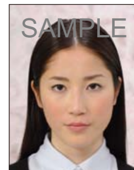
背景に柄があるもの