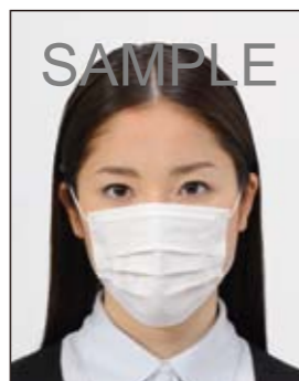
✕ 顔の器官が隠れる装飾品等があるもの