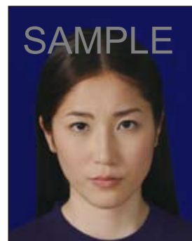
背景の色がきつく人物を特定しづらいもの