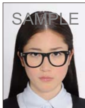
✕ フレームが非常に太く目や顔を覆う面積の大きいもの