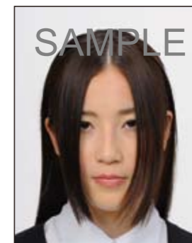
前髪が長すぎて目元が見えないもの 顔の輪郭が隠れるもの