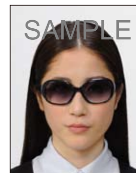
サングラスをかけ人物を特定できないもの