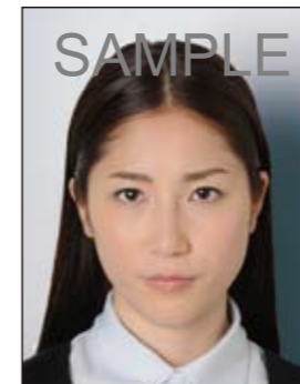
✕ 背景に影があるもの

デジタル印刷の場合、ドット（網状の点）やジャギー（階段状のギザギザ模様）、インクのにじみなどがみられるものは不適当です。写真専用紙等を使用し、鮮明な画質で印刷してください。