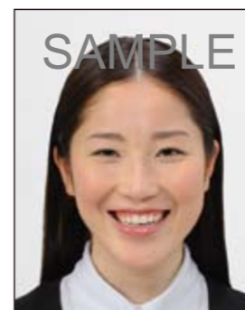
平常の顔貌と著しく異なるもの