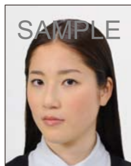
顔が横向きのもの