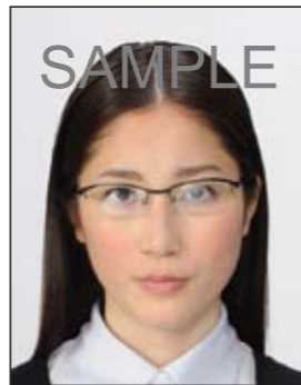
✕ 照明が眼鏡に反射したもの

撮影時にピントが合っていないか、ブレしてしまったために画像が不鮮明なものや背景に人物の影があるものは不適当です。