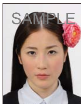
✕ 顔や頭の輪郭が隠れる装飾品等があるもの

画像ファイルの過剰な圧縮等が原因となってノイズ（画像の乱れ）が発生しているもの、変形やマスクング（縁取り）などの画像処理を施したものは不適当です。