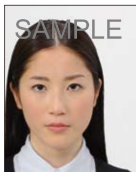
顔の位置が片寄っているもの