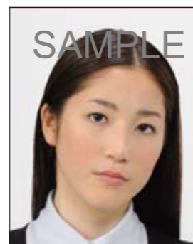
顔が左右に傾いているもの