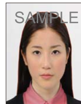
✕ 変形やマスクングなどの画像処理を施したものの

頭髮のボリュームが極端に大きな場合には、下図に示すように「両眼の中心から頭頂までの距離」は「両眼の中心から顎までの距離」と等しいものとみなして、トリミングしてください。