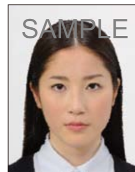
✕ ノイズがあるもの

画像ファイルの過剰な圧縮等が原因となってノイズ（画像の乱れ）が発生しているもの、変形やマスクング（縁取り）などの画像処理を施したものは不適当です。