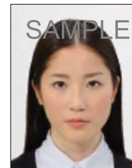
✕ ジャギーがあるもの

眼鏡やヘアバンド以外にも、帽子や衣服、布、マスク、イヤリング、カチューシャなど顔の器官が隠れるような大きめの装飾品等は好ましくありません。なお、顔の器官を隠さず髪を上げるため等の小ぶりの装飾品は受理しますが、着ける箇所によっては不適当となる場合があります。大きさ等の判断に迷う場合は装飾品をはずした写真をお持ちください。