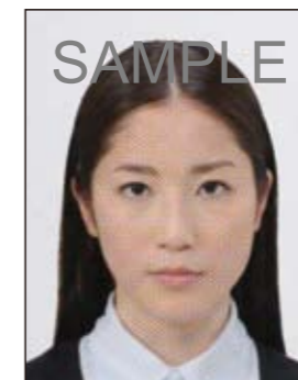
✕ ドットやインクのにじみなどがあるもの

デジタル印刷の場合、ドット（網状の点）やジャギー（階段状のギザギザ模様）、インクのにじみなどがみられるものは不適当です。写真専用紙等を使用し、鮮明な画質で印刷してください。