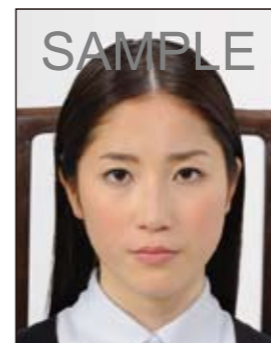
椅子等背景があるもの