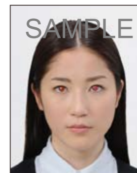
瞳がフラッシュ等により赤く写ったもの