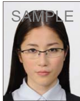
✕ 眼鏡のフレームが目にかかっているもの

今後、出入国審査等で旅券に内蔵されている IC チップに記録された顔画像とその旅券を提示した人物の顔を電子機器等で照合することが見込まれ、眼鏡のフレームや照明の反射が目にかかっているものやフレームが非常に太いものなどは、照合の妨げとなる可能性がありますので注意が必要です。