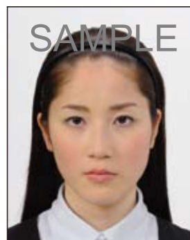
○ 顔の器官を隠さず、小ぶりのもの

眼鏡やヘアバンド以外にも、帽子や衣服、布、マスク、イヤリング、カチューシャなど顔の器官が隠れるような大きめの装飾品等は好ましくありません。なお、顔の器官を隠さず髪を上げるため等の小ぶりの装飾品は受理しますが、着ける箇所によっては不適当となる場合があります。大きさ等の判断に迷う場合は装飾品をはずした写真をお持ちください。