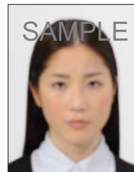
✕ ピンボケや手ブレにより不鮮明なもの

撮影時にピントが合っていないか、ブレしてしまったために画像が不鮮明なものや背景に人物の影があるものは不適当です。