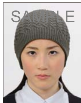
帽子によって頭部が隠れているもの