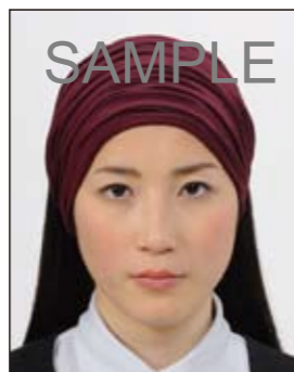
幅の広いヘアバンド等により頭部が隠れているもの