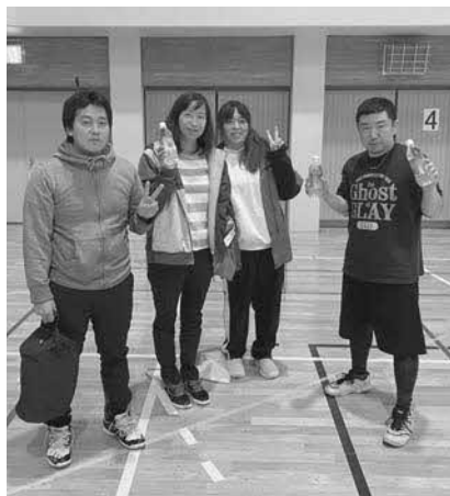
Bブロック優勝 teamすずめ