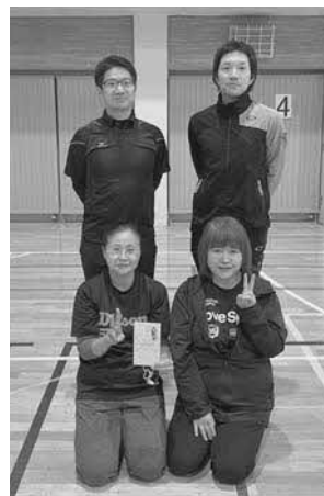
Cブロック優勝 ホームタップ①