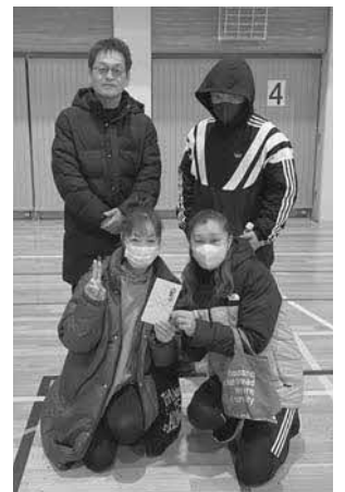
Dブロック優勝 ホッシー