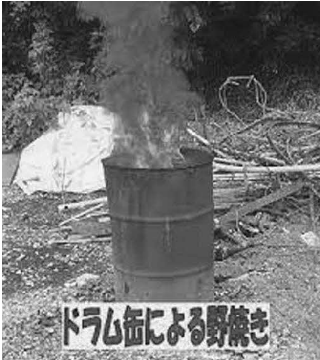
ドラム缶による野焼き

焼却するものが自己物か他人物かに関係なく、また一般廃棄物と産業廃棄物との区分なく、野外での廃棄物の焼却は、原則禁止されています。