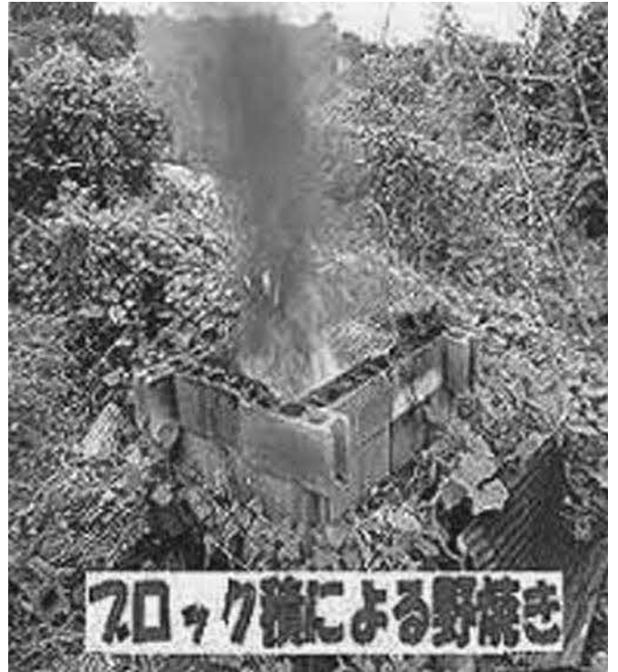
ブロック積みによる野焼き