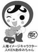
人権イメージキャラクター 人KENあゆみちゃん