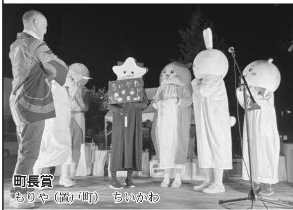
町長賞 もりや(置戸町) ちいかわ