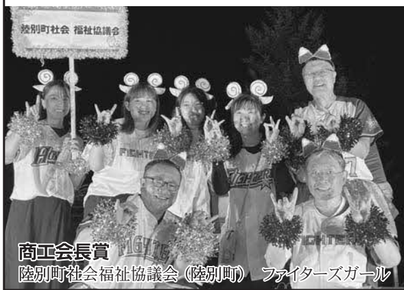
商工会長賞 陸別町社会福祉協議会(陸別町) ファイターズガール