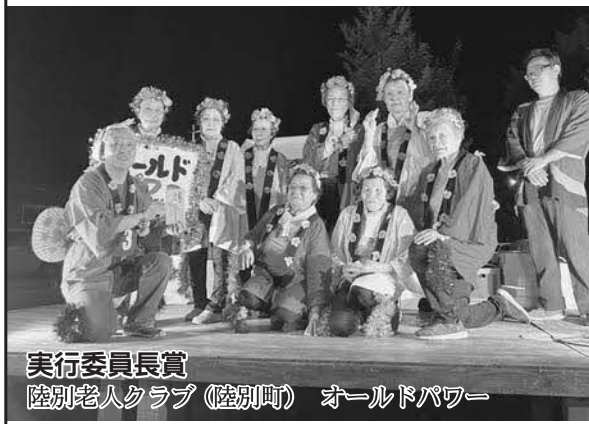
実行委員長賞 陸別老人クラブ(陸別町) オールドパワー