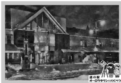
表紙は町民お馴染みの風景「陸別町道の駅」にしました。ぜひお手元にとってご覧ください。

陸別町版エンディングノートの配布について 町内に住む65歳以上の方を対象に、地域包括支援センター職員が書き方を説明してお渡しします。直接保健センターに来所していただくか、毎月行っている「ほっとカフェ」の会場でもお渡しできます。