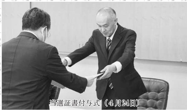
当選証書付与式（4月24日）