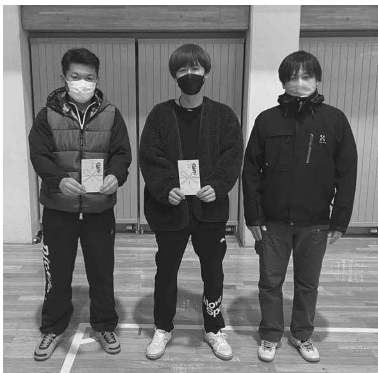
優勝した「若葉2」チーム