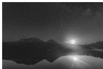
最優秀賞「月下の流星」

2022オンネトーフोटコンテストに寄せられた作品のうち、最優秀作品を含む約20点を展示する写真展を実施します。色が変化する神秘的な湖オンネトーの魅力が詰まった写真展です。ぜひご覧ください。