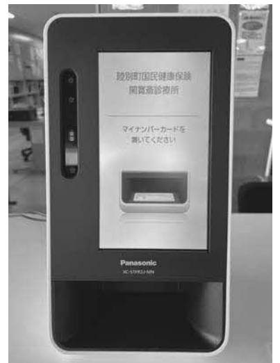
カードリーダー ※表紙にも掲載しています

情報提供は任意となります。機器やシステムに顔写真データは保存されませんのでご安心ください。