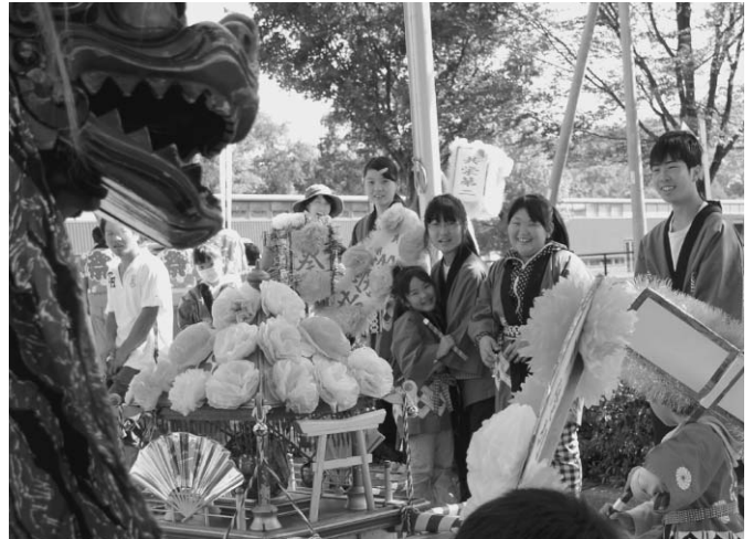
9/21 陸別神社の秋季例大祭が行われました。この日は、すがすがしい秋晴れに恵まれ、陸別神社を出発した御輿が市街地を練り歩きました。また、各自治会の子ども御輿も練り出し、秋のひとつときを楽しんでいました。