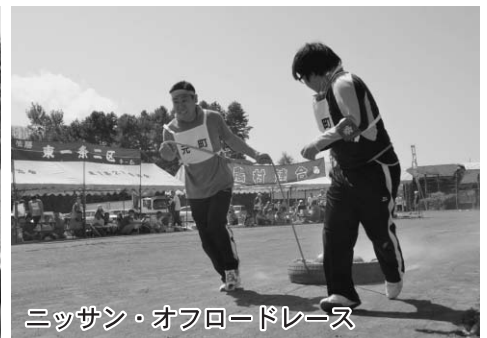
ミッサン・オフロードレース