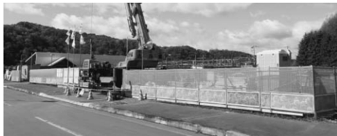
7月から建設が進められている給食センター