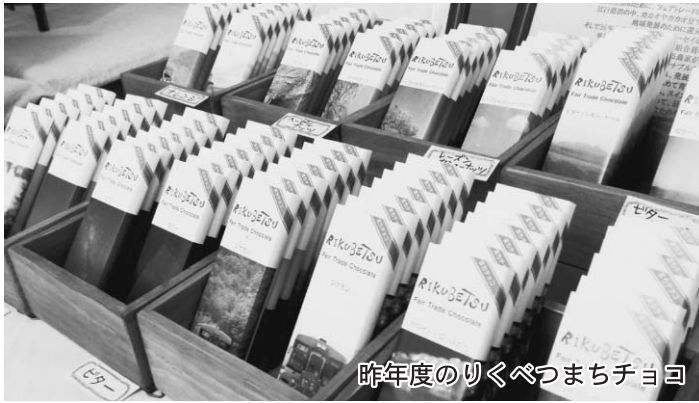
昨年度のりくべつまちチョコ