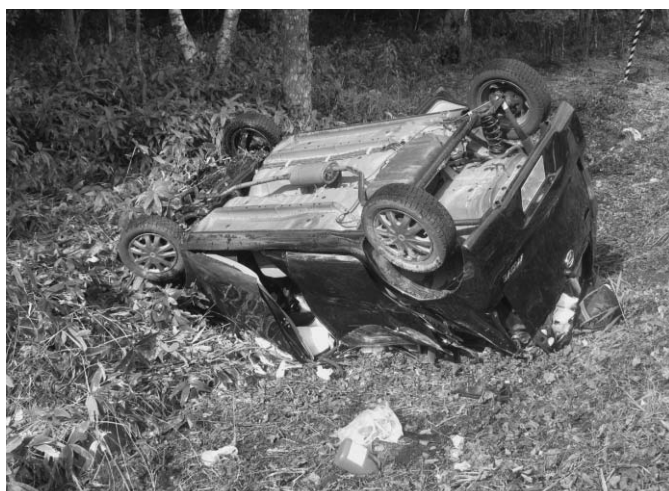
9/18 この日、町内鹿山で発生した交通事故により、平成9年7月から続いていた「交通事故死ゼロ」の記録が、6,274日で途切れました。再び交通事故のない町を目指して新たなスタートです。