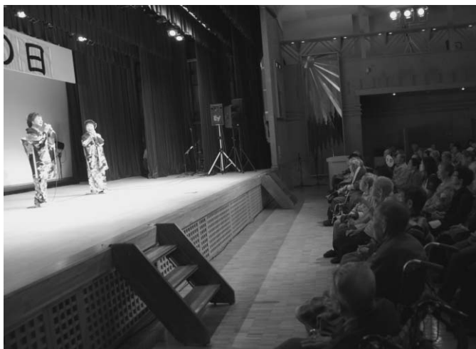
9/17 今年度の敬老会「こまどり姉妹」歌謡ショーがタウンホールで行われました。参加したお年寄りや関係者約300人は、往年のヒット曲や2人が体験した戦後の苦労話、デビュー当時の逸話などを楽しみました。