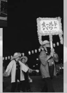
(写真上から) 団体の部優勝の陸別老人クラブ「オールドパワー陸別老人クラブ」、準優勝の笑輪楽々組「連獅子参上」、第3位のシルバレーデイス「花笠」