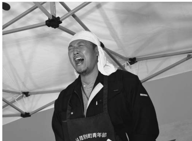
7/26 屋台村（陸別町商工会青年部主催）が駅前多目的広場で行われました。雨天の開催となりましたが、訪れた来場者はビールを片手に各屋台自慢の料理や大声コンテストで夏の一夜を楽しみました。