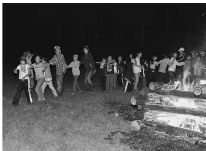
7/30 今年のサマーインりくべつが7月27日から8月1日までの日程で行われ、陸別と本州からの参加者70名が夏の陸別で交流しました。この日はキャンプファイヤーが行われ、フォークダンスを楽しみました。