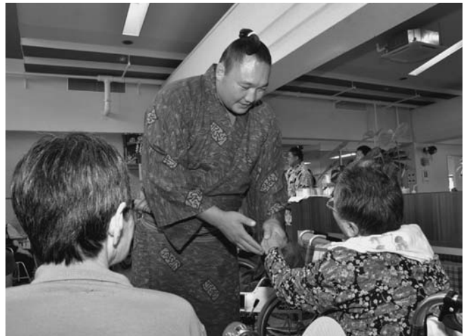
8/18 大相撲で活躍中の幕内力士の荒鷲関と幕下力士の豪頂山、十両格行司の木村光之助さんが来町。町内の施設や小学校、保育所を訪問し、力士らと記念撮影や質問をするなど貴重な時間を過ごしました。