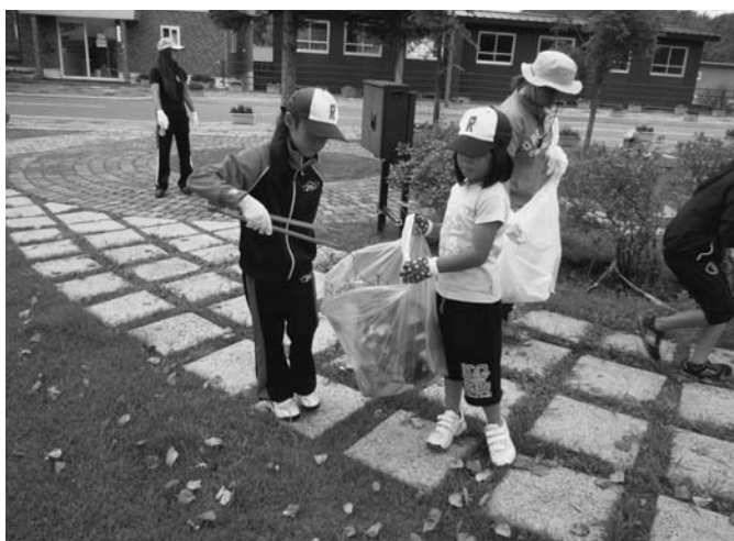
8/10 陸別野球少年団が奉仕活動の一環として町内のゴミ拾いを行いました。参加した団員や保護者ら21名は、2班に分かれて診療所前を出発。1時間かけて道の駅周辺までのゴミを丁寧に拾いました。