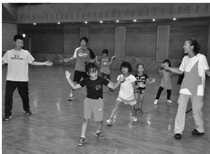
8/6 ヒップホップダンス教室が6日から全3回の日程で行われました。小中学生がプロのインストラクターから楽しくダンスを学び、3回目にはキレの良いダンスを踊れるほど上達していました。