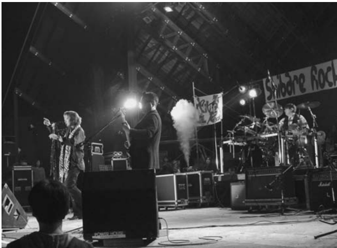
7/5 今回で8回目となる「しばれロックフェスティバル」がイベントセンターで開催されました。アマチュアバンド11組が町内や十勝・網走管内から参加し、来場者は夏の一夜を様々な音楽で楽しみました。