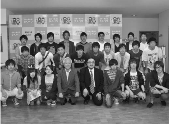
7/4 北海学園大学の学生26名が陸別町における地域振興事業の調査のため来町しました。学生らは、「まちチョコ」やイベントの取り組みについて町内の関係者から聞き取りを行い、6日まで滞在しました。