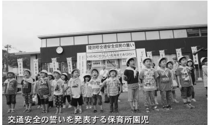
交通安全の誓いを発表する保育所園児

7月18日 今年度の交通安全住民の集いが保健センター前庭で行われ、町民250人が交通事故のない町へ決意を新たにしました。