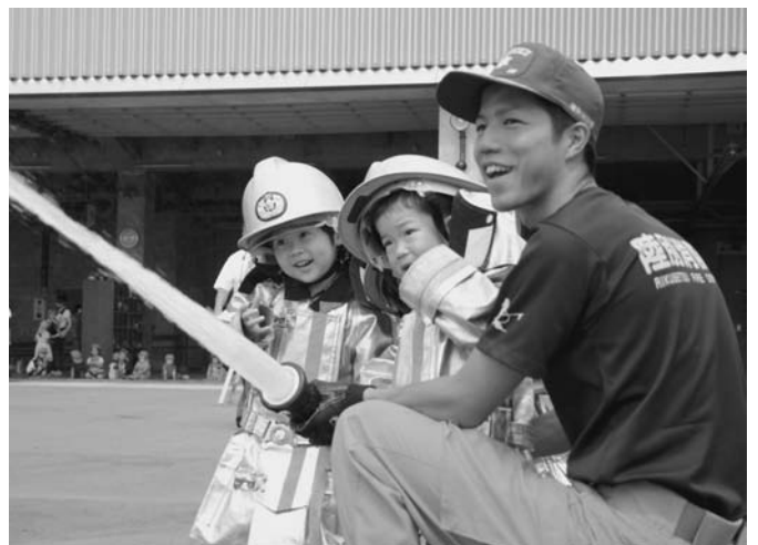
7/3 陸別保育所園児を対象とした、ちびっこ防火フェスティバルが陸別消防庁舎前で行われました。園児は放水訓練や消防車の体験乗車を楽しみ、署員による救出訓練を見学。消防署の役割を肌で感じていました。