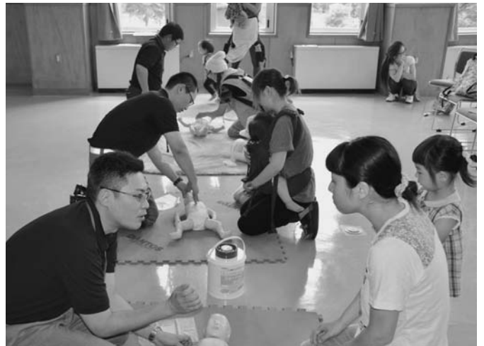
7/2 育児サークル「らっこクラブ」による陸別消防署見学が行われ、37名が参加しました。参加者は、署員の指導で乳幼児の人形を使った救命実習を行い、親子で消防車に乗車するなど楽しんでいました。