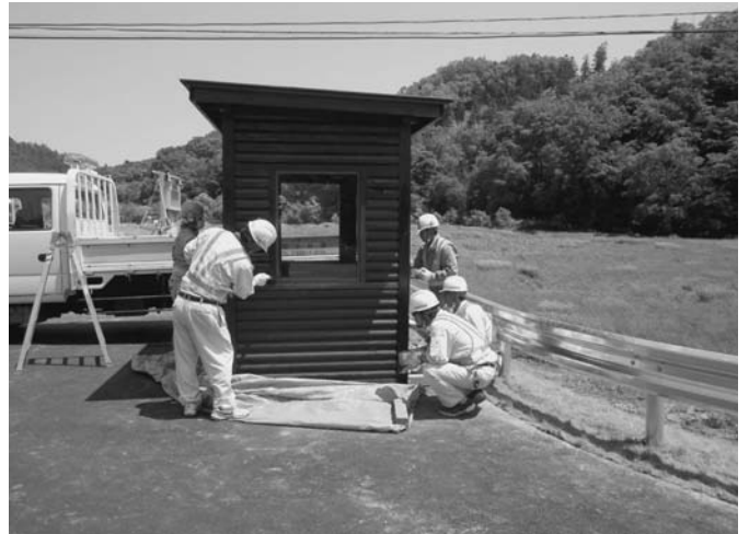
6/25 楸石橋建設が地域貢献活動の一環として、川上バス停留所の塗装、清掃作業を行い、社員6名が劣化した外壁に防腐塗料を塗りました。同社では、これからも地域のために活動を続けたいとしています。