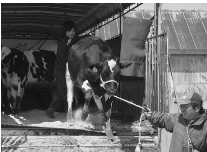
5/23 町内ポイントマム地区の畜産センターへの入牧が始まり、町内の酪農家などから集まった約700頭の牛が放牧されました。牛たちは、広い放牧地でのんびりとこの夏を過ごします。