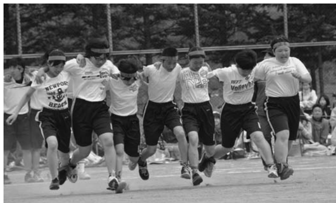
5/24 第55回陸別中学校体育祭が行われました。全校生徒59名が、今年のスローガン「百花繚乱」のもと、ひとり一人が練習の成果を発揮。その頑張る姿に会場からは大きな声援が送られました。