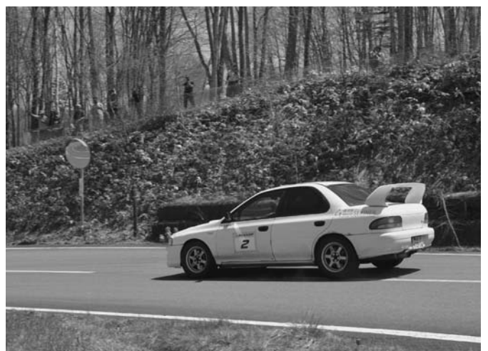
5/11 舗装路のラリー競技「スーパーターマック2014」が銀河の森周辺で行われました。この日は天候にも恵まれ、集まった観客は22台の競技車両の走りに注目していました。