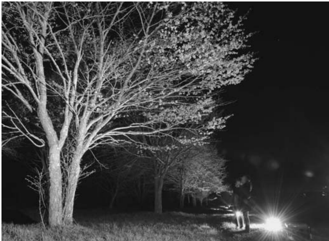
5/11 町内上斗満地区の桜が見頃を迎え、観光協会による夜桜のライトアップが12日まで行われました。また、上斗満自治会恒例の花見も行われ、地域の皆さんが桜を肴に交流しました。