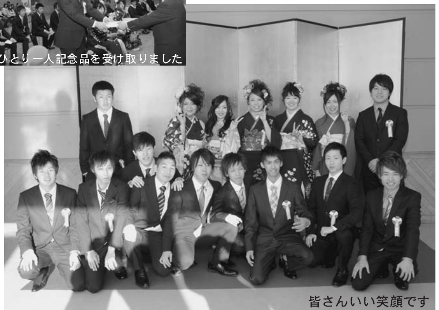
皆さんいい笑顔です