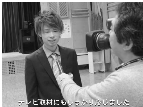
テレビ取材にもしっかり応じました