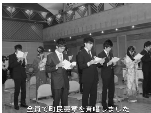
全員で町民憲章を斉唱しました