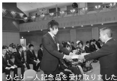
ひとり一人記念品を受け取りました