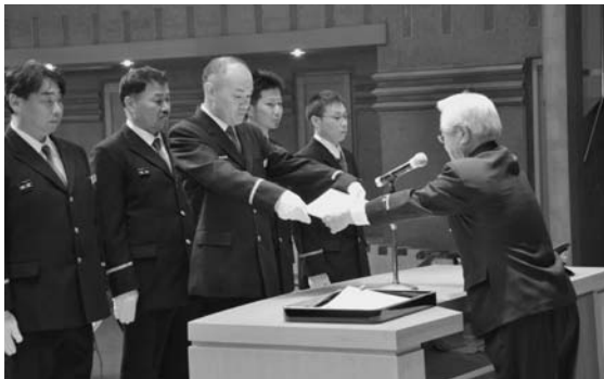
勤続表彰の伝達が行われました