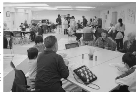
▶婦人会ボランティアバザールでの食事の様子（11月2日保健センター多目的室）