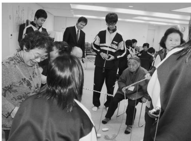
11/6 ふれあい昼食会が保健センターで行われ、陸中3年生とお年寄りが交流しました。中学生が準備したゲームなどを楽しみ、昼食後は中学生が合唱を披露。参加者から大きな拍手が送られました。