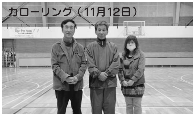
優勝 下陸別B 準優勝 下陸別C 第3位 若葉町A