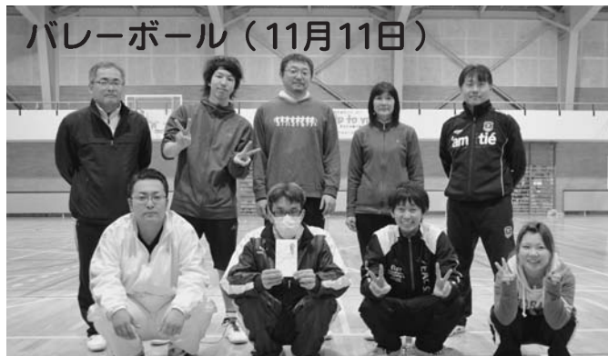
優勝 緑町 準優勝 共栄第1 第3位 東1条2区

11月11日から14日までの4日間の日程で開催され、4競技に延べ44チームが出場しました。 多くのご参加ありがとうございました。 ※写真は優勝チームの皆さんです