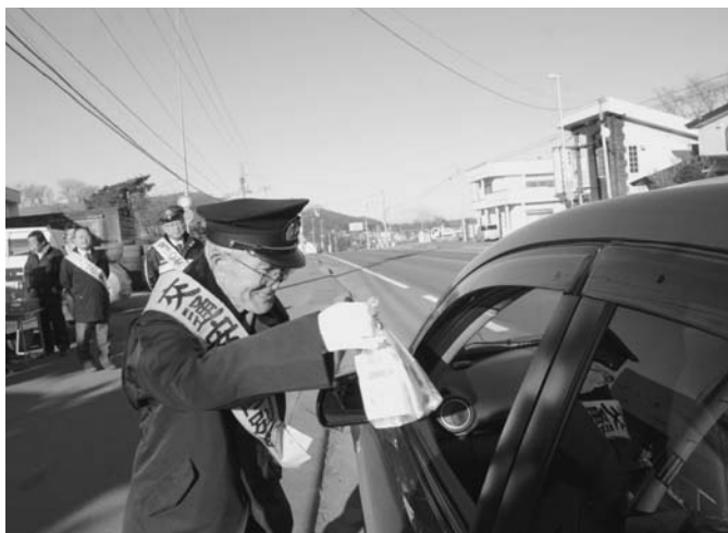
11/14 冬の交通安全運動の一環として、交通安全指導員による啓発運動が新町2区の国道で行われました。寒風が吹く中、約100台の車両に安全運転を呼びかけ飲み物などを手渡しました。