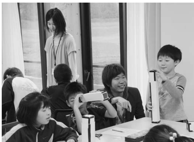
11/15 北海道大学、名古屋大学、国立環境研究所による出前授業が陸別小中学校で行われました。陸小では3・4年生が、「ガリレオ式望遠鏡」の作成に挑戦。講師の説明を聞きながら楽しく完成させました。