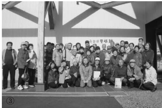
③「ふるさとの遺跡を歩く」（網走市モヨロ貝塚館）に参加した皆さん