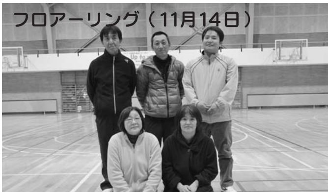
優勝 下陸別B 準優勝 栄町B 第3位 農村連合