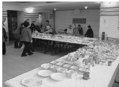
◀陶芸ボランティアセールの様子（11月2日役場1階ロビー）

文化祭に続いて11月9日から16日には道民芸術祭・十勝管内郷土芸術祭の展示部門がタウンホールで行われました。陸別・足寄・本別の三町の文化団体から数多くの作品が出品され、来場者の目を楽しませました。