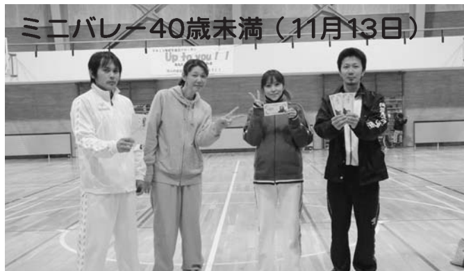
優勝 新町1区 準優勝 共栄第1A 第3位 共栄第2