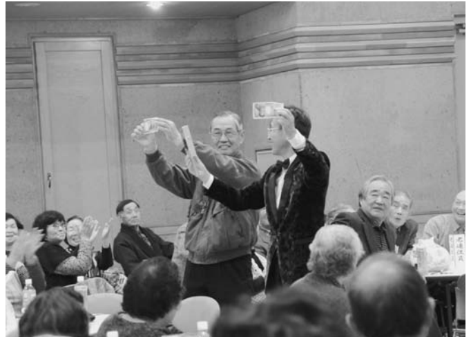
11/19 生き生き元気昼食会・発表会がタウンホールで開催され、お年寄りや関係者など約250人が集まりました。昼食後には、マジックショーや各老人クラブの発表が行われ、楽しいひとときを過ごしました。