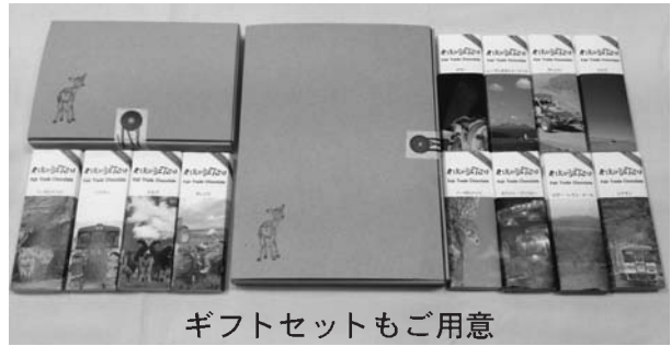
ギフトセットもご用意