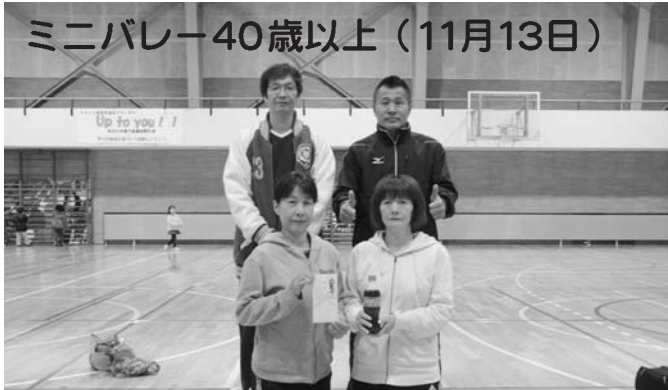
優勝 若葉町 準優勝 新町1区 第3位 農村連合