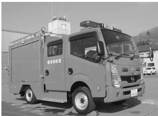
10/31 陸別消防団に新しい消防車（小型動力ポンプ付き積載車）が納車となり、この日は入魂式が行われました。また、消防団員が装備や操作方法について説明を受け、有事の際の出動に備えました。