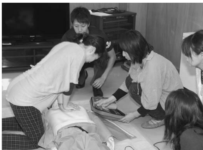
9/9 陸別中学校のPTA研修会が陸別消防署で開催され、参加者19名が救急講習を学びました。スライドで説明を受けた後、実際に人形を用いてAEDの使用方法をグループに分かれて体験しました。