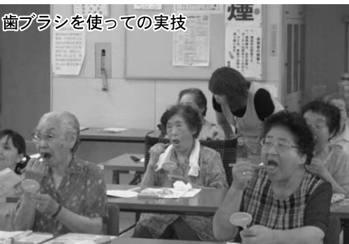
歯ブラシを使つての実技

A 「寝る前にブラシで舌のマッサージをしています。口が渴くのでマウスウオッシュもしています。教えてもらった歯につかない