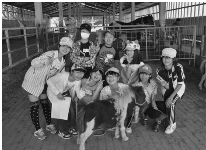
8/28 陸小6年生を対象とした「馬とのふれあい学習」が陸別町馬産振興会の協力で行われました。児童は、乗馬や馬との綱引きを楽しみ、「馬の乳は飲めるのか？」など積極的に質問もしていました。