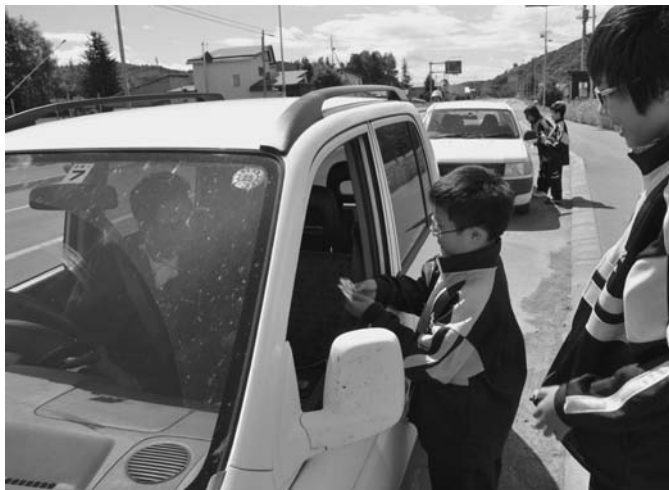
9/6 陸中1年生による交通安全啓発が新町2区の国道で行われました。この啓発運動は総合的な学習の授業として行われ、生徒ひとり一人が手作りのお守りなど手渡しながら交通安全を呼びかけました。