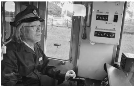
▶自ら「メーテル号」を運転体験