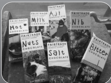
完成品イメージ写真 (Slow Water Cafeのチョコレートの例)