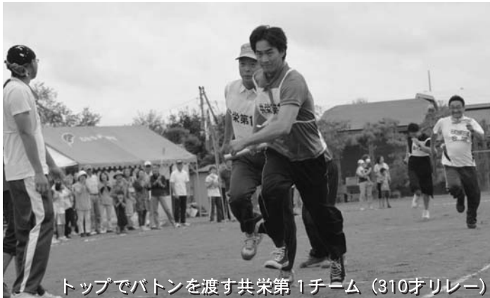
トップでバトンを渡す共栄第1チーム (310オリレー)