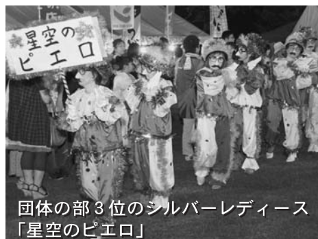
団体の部3位のシルバーレディース 「星空のピエロ」