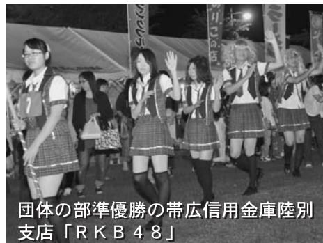
団体の部準優勝の帯広信用金庫陸別支店「RKB48」