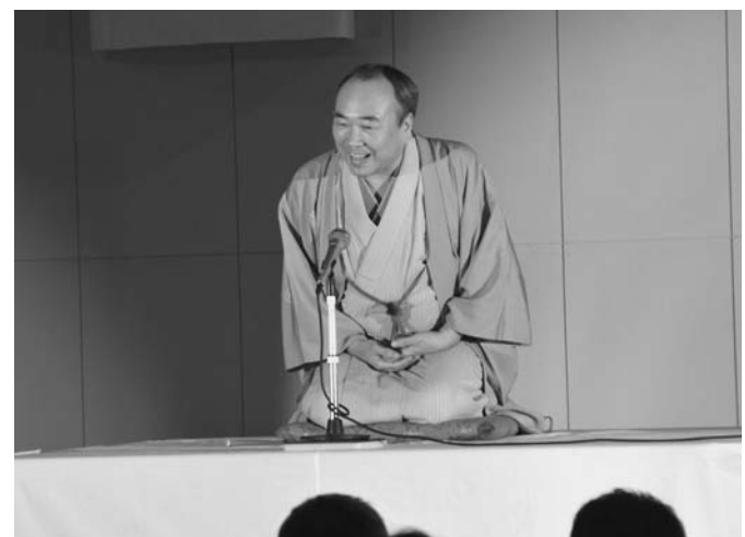
7/13 第5回スターライトフェスティバルが銀河の森天文台で行われました。今回は、落語家の柳家小糸ん師匠による星空独演会や事前に募集していた彗星にまつわる川柳の優秀作品の発表が行われました。