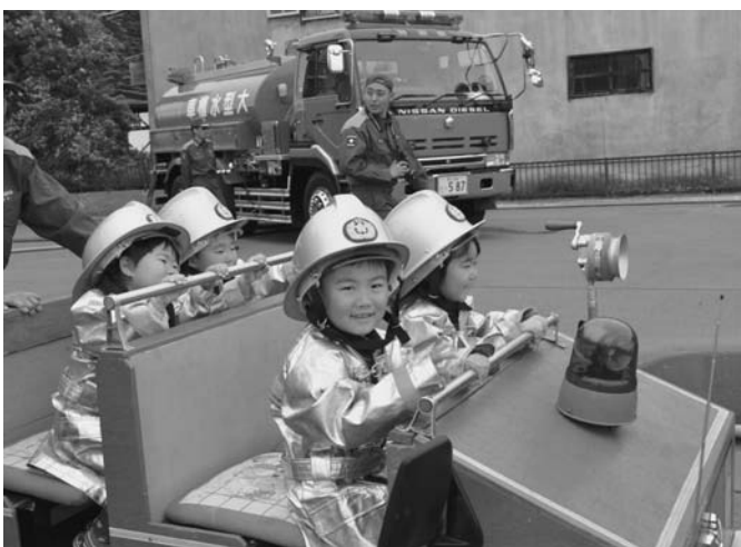
7/25 ちびっこ防火フェスティバルが、陸別消防庁舎前で行われました。参加した陸別保育所園児は、消防服に着替えて放水訓練を体験。消防署員による降下訓練の見学では大きな歓声を上げていました。