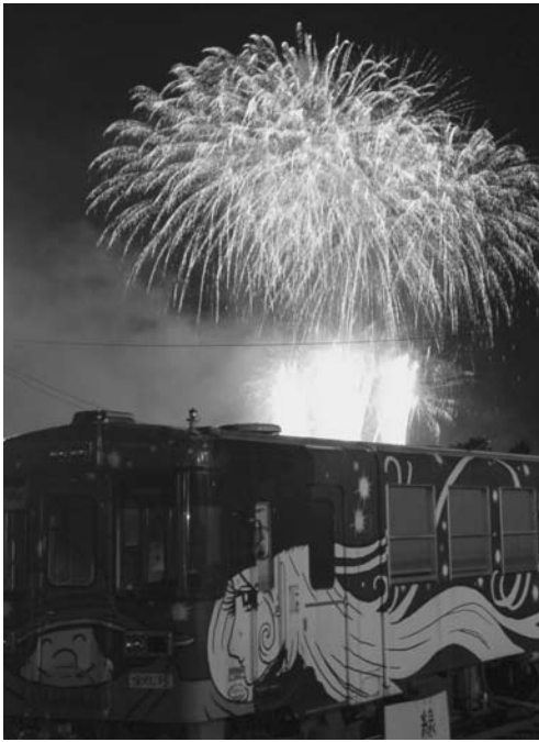
1500発が打ち上げられた花火大会 (20日 駅構内より撮影)