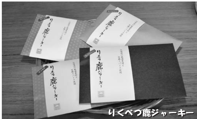
りくべつ鹿ジャーキー

処理できるように、施設を一部改修しております。▼今まで、酪農のまち「りくべつ」にもかかわらず、特産品である「牛乳」の飲用販売や加工品としての利用をすることができませんでした。今回の施設改修により可能となります。▼地場産品を利用した加工品の開発に興味のある方はぜひご相談ください。▼施設改修にあたりご不便をおかけしますがご協力をよろしくお願いいたします。