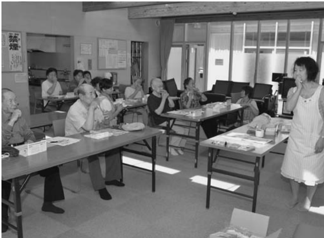
7/22 保健福祉センターによる「健口講座」がふれあいの郷で行われました。自分の口内の状況を試験紙で確認し、歯ブラシの使い方や唾液の大切さなどについて学びました。この講座は、全6回で行われます。