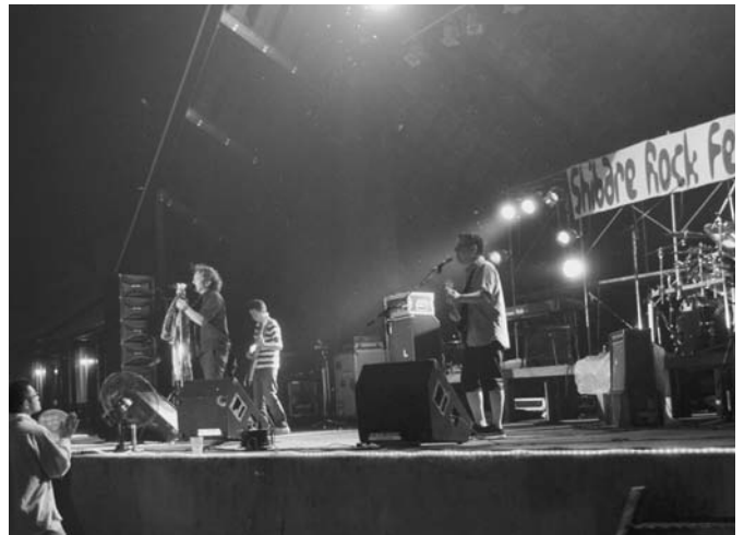
7/6 今年で7回目となる「しばれロックフェスティバル」がイベントセンターで開催されました。来場者は、町内をはじめ、十勝管内、網走管内から参加したアマチュアバンドの演奏を楽しみました。