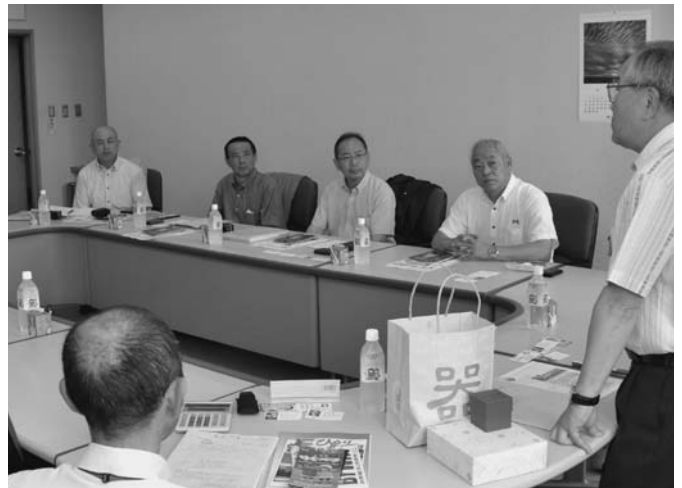
7/9 日本一暑い町として有名な岐阜県多治見市の市議会議員など4名が行政視察のため来町しました。当町のしばれを生かした町づくりを説明し、日本一寒い、暑い町の連携について意見交換を行いました。