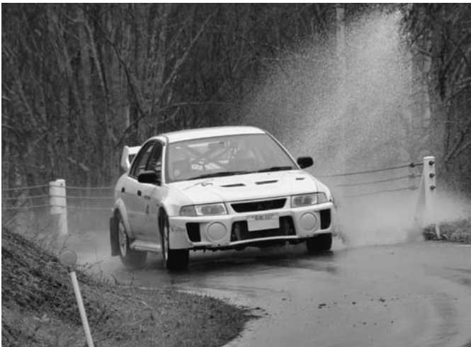
5/12 今年最初のラリーレースとなるスーパーターマック2013が銀河の森周辺を会場に行われました。残念ながら雨天での開催となりましたが、出場した選手達は滑る路面を果敢に攻めていました。