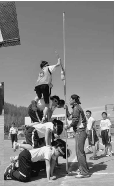
5/25 54回目となる陸別中学校体育祭が開催されました。この日は心配された天候も朝の曇りから午前中には晴れ間が広がり、生徒達は、生徒会スローガン「Up to you!!」のもと、練習に励んできた成果を充分に発揮していました。