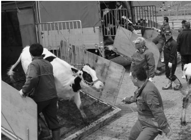
5/24 町内ポントマム地区にある畜産センターの入牧が始まりました。天候不順の影響で例年より1週間程度遅れての入牧となりましたが、町内から集まった約800頭の牛が広い放牧地でこの夏を過ごします。