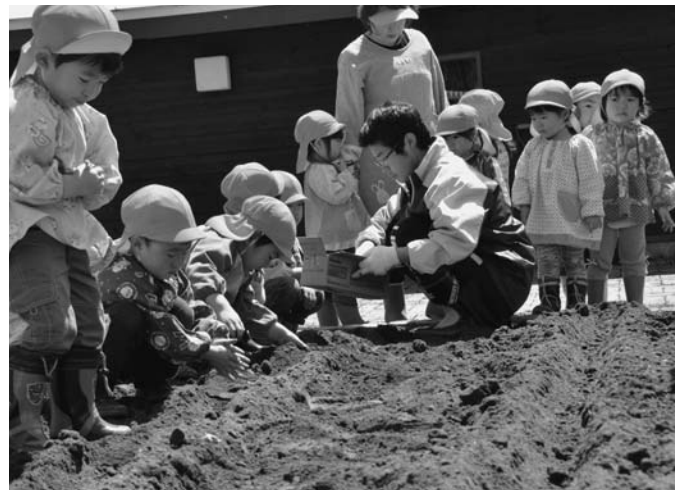
5/10 毎年恒例となるジャガイモの植え付けが陸別保育所で行われました。園児達は園庭の畑に大事そうに種イモを置き、丁寧に土をかけました。9月の収穫を今から楽しみにしているようでした。