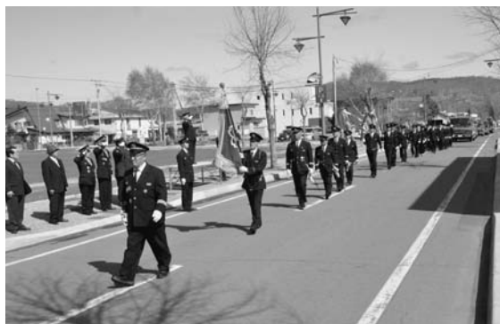
5月26日(日) 陸別消防団による春季消防演習が陸別消防庁舎前で行われました。演習では、放水訓練など日頃の訓練の成果を披露し、道の駅前を行進しました。 また、演習終了後には、7月19日に江別市で開催される「北海道消防操法訓練大会」に十勝の代表として出場する陸別消防団の結団式が行われ、出場隊5名を激励しました。