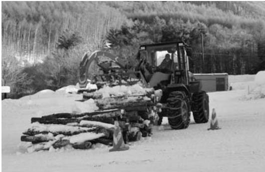
「命の火」薪運搬作業