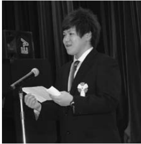
成人の決意を述べる板花さん