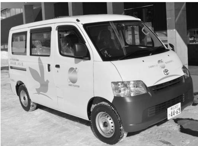
1/29 24時間テレビ「愛は、地球を救う」（日本テレビ）から「訪問用入浴車」が陸別町社会福祉協議会に贈呈され、この日納車されました。この贈呈は、同番組に集まった募金の活用事業によるものです。