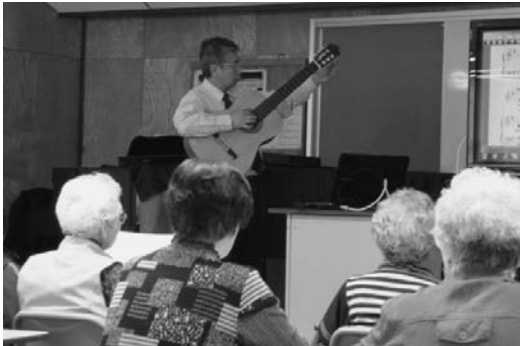
5月 音楽の楽しみ方