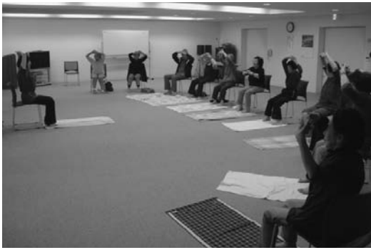
10月 ヨーガで楽しく健康づくり