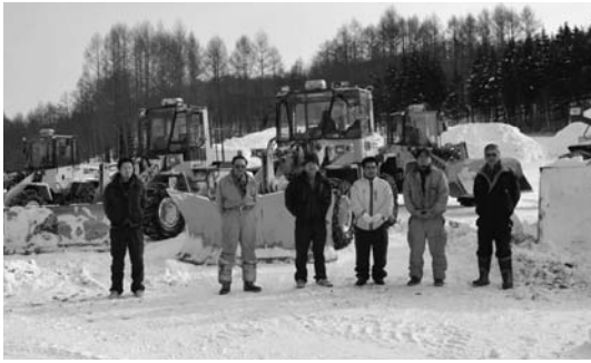
駐車場除排雪作業