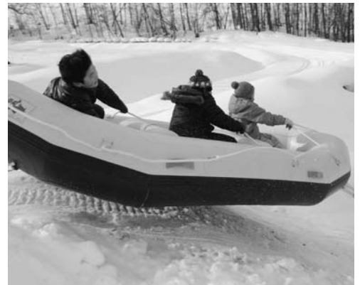
迫力の「スノーラフティング」

3日(日)は、冷たい風が吹きつける1日となりましたが、訪れた来場者は「しばれ縁日」の食事などで体を温め、スノーモービルやスノーラフティング、スノーラリーなど冬ならではの体験メニューを楽しみました。