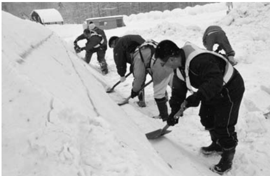
ステージ前観覧席製作