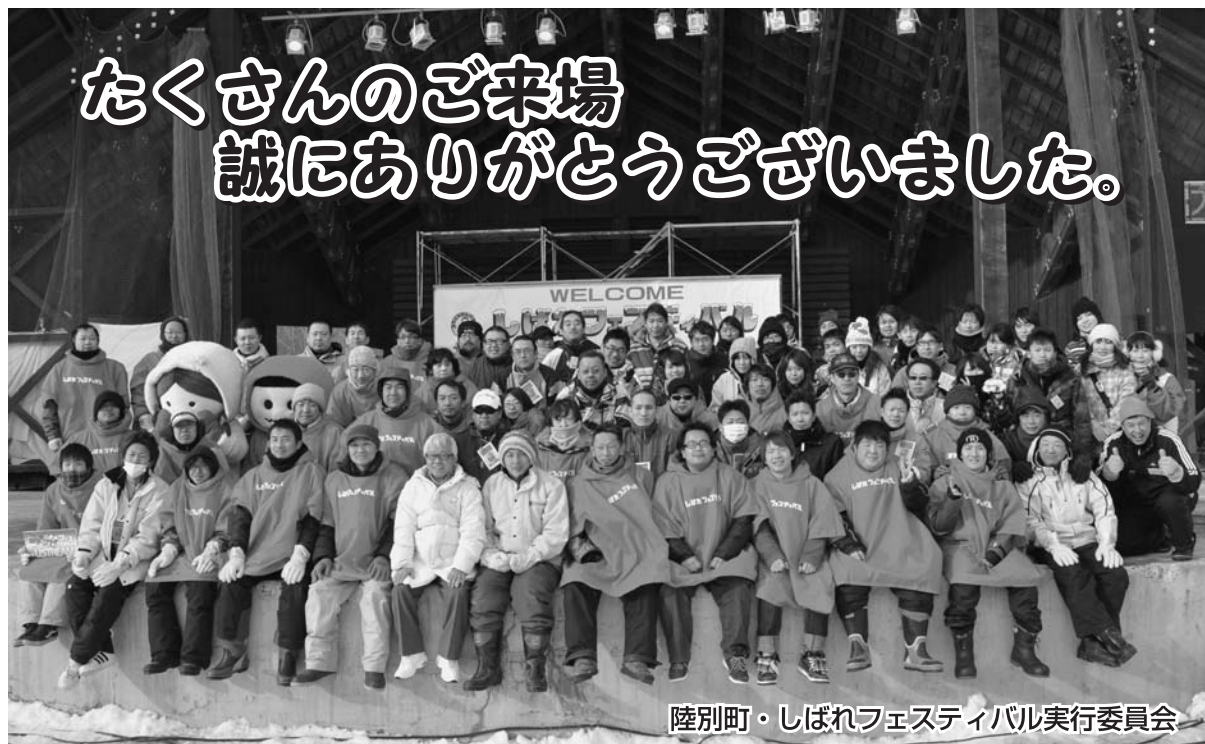
陸別町・しばれフェスティバル実行委員会