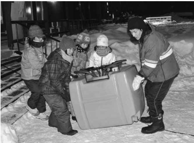
1/26 陸小5・6年生によるしばれフェスティバル準備体験が行われ、バルーンマンションの水かけ作業などを体験しました。作業後、同実行委から「1日実行委員」を証明する缶バッジを受取りました。