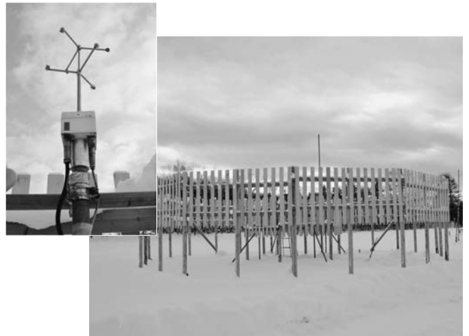
12/22 下陸別の国立極地研究所の観測施設に「3次元風速計」が設置されました。作業には、陸別町しばれ開発研究所も協力。設置により全方向の風速が観測され、より詳細なデータ収集が可能となりました。