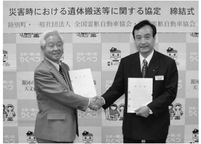
12/14 一般社団法人全国霊柩自動車協会、帯広霊柩自動車協会と陸別町の三者による「災害協定」が締結されました。この協定は、大規模な災害時における迅速かつ円滑な遺体搬送を目的としたものです。