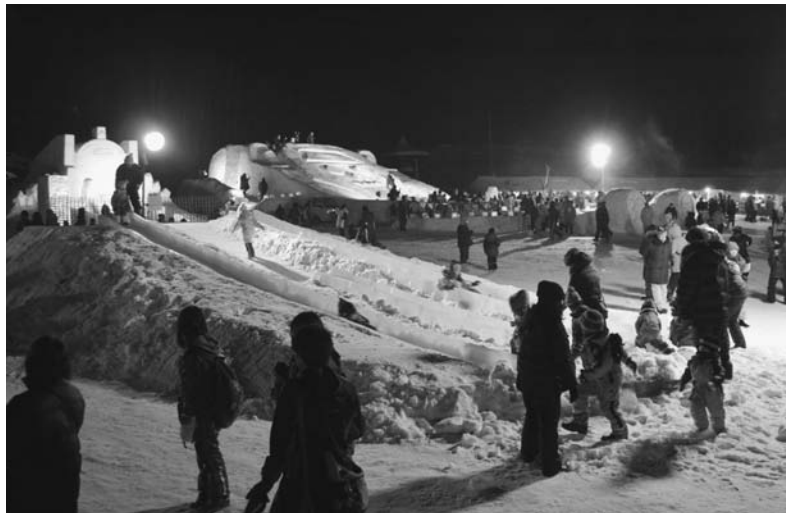
2日(土)の会場の様子(写真上)と恒例の「しばれ花火」(写真左)が1500発打ち上げられました。