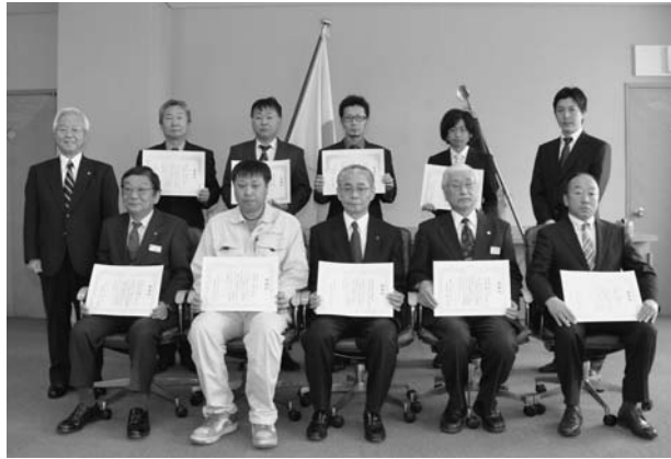
1月30日 地域貢献活動感謝状授与式

しばれフェスティバル会場設営作業に地域貢献活動の一環として、11社のご協力をいただきました。 1月30日にそのご協力に感謝の意を込めて町より感謝状が贈られました。