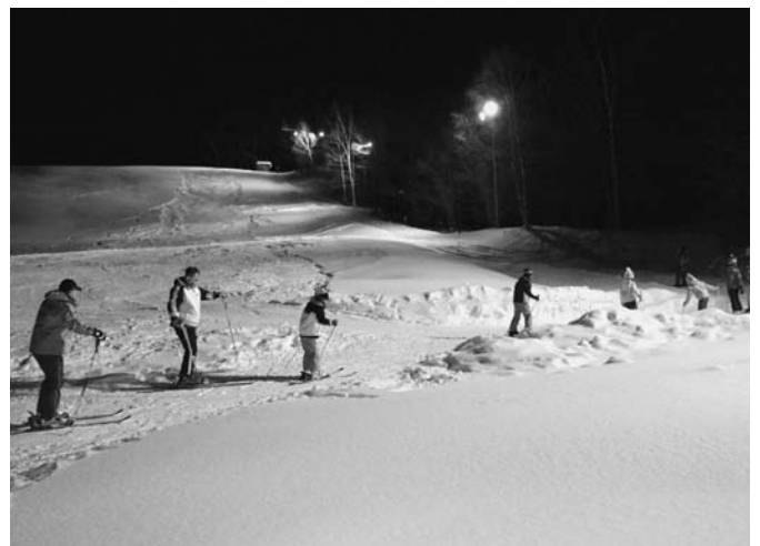
1/15 ナイタースキー教室が、15日から3日間行われ、11名が参加しました。17日の最終日には「バッジテスト」も行われ、6名が合格。また20日には、糠平で移動スキー教室も行われました。