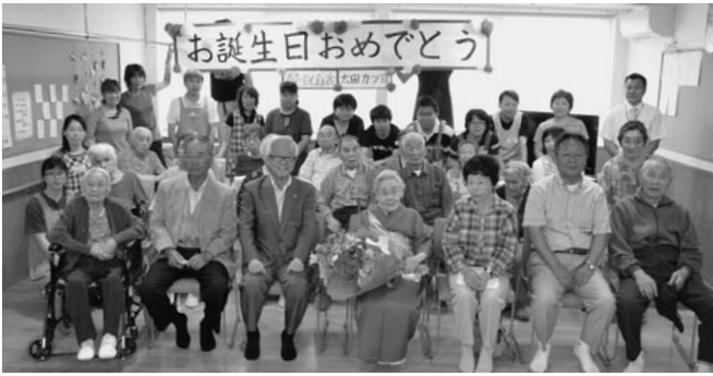
ご家族やあいの里の皆さん、関係者で祝いました。