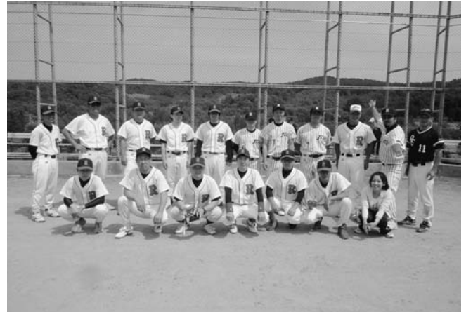
*写真は軟式野球で優勝した陸別町チームのみなさんです。