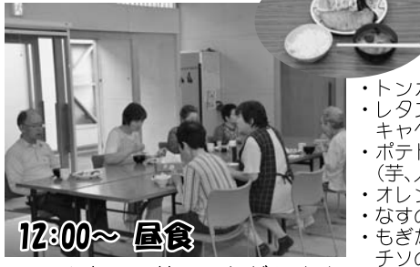
12:00～ 昼食 ～みんなで一緒にいただきます。