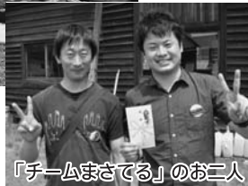
「チームまさてる」のお二人

イムで2位に14秒の差をつけて優勝しました。また、会場では、本物の蒸気機関車による「ミニSL」が運行し、子供からお年寄りまで幅広い年齢の方々が試乗しました。