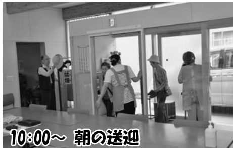
10:00～ 朝の送迎 ～挨拶でお迎えます。