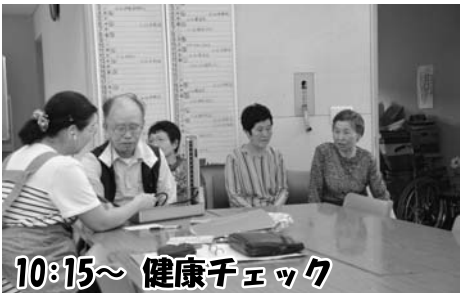
10:15～ 健康チェック ～到着後、血圧測定と健康相談に応じます。