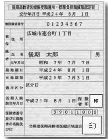
(色はオレンジです)