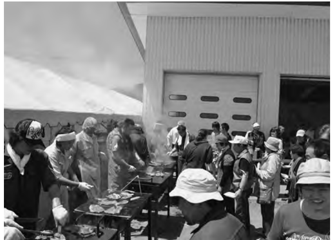
6/2 「第17回農業祭」（陸別町農業協同組合主催）が開催されました。この日は晴天に恵まれ、恒例のステーキ食べ放題や牛乳の早飲み、子供対象のクイズなども行われ、多くの来場者で賑わいました。