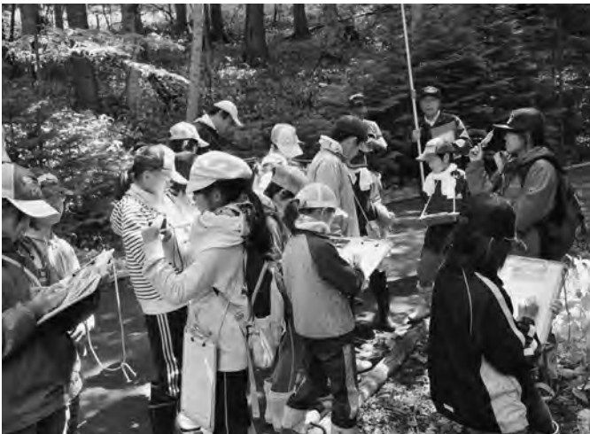
6/22 陸小5年生の授業として「森林教室」が、宇遠別国有林のふれあいの森で行われました。十勝東部森林管理署職員が木の特徴や森の役割について説明し、子供たちの質問に答えました。