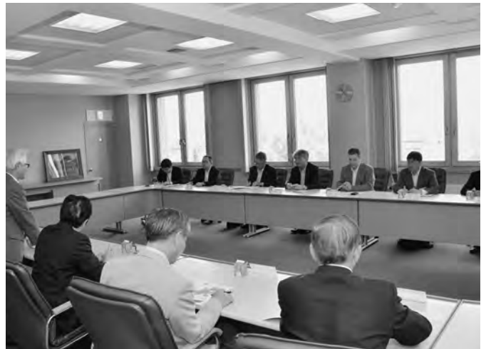
6/5 高松 泰北海道開発局長をはじめとする開発局関係者7名が来町し、町内関係団体の代表者と懇談会を行いました。町からは、高速道路の延伸について、その重要性を説明し、早期着工を要望しました。