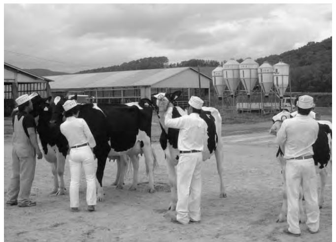
6/6 「第42回陸別町家畜共進会」（陸別町農業協同組合主催）がJA陸別町育成センターで開催されました。出陳牛40頭（黒毛和牛の部12頭、乳牛の部28頭）が、それぞれの部で最高位を争いました。