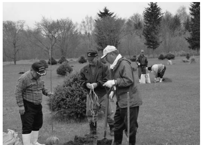
5/11 上斗満自治会では、旧上斗満小中学校グラウンド跡地に新たにエゾヤマザクラの苗木30本を植樹しました。数年後の春が更に待ち遠しくなりました。