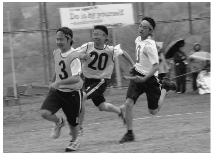
5/26 第53回となる陸別中学校体育祭が行われました。残念ながら雨、低温という悪天候の中での開催でしたが、生徒たちの頑張りや真剣さが伝わる体育祭でした。