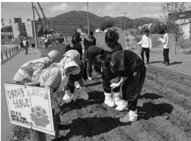
5/24 (株)石橋建設は、社会貢献事業の一環として「とかちイエローリボンプロジェクト」に参画し、国道敷地にひまわりの種をまきました。この日は、修学旅行中の京都の中学生12名も参加しました。