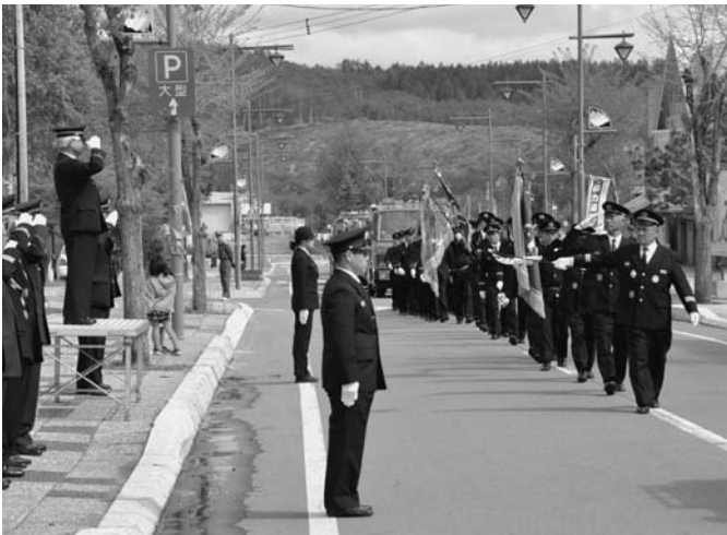
5/27 陸別消防団の春季消防演習が陸別消防庁舎広場で行われ、小隊訓練や放水訓練など日頃の訓練の成果を披露し、大通から消防庁舎まで分列行進を行いました。