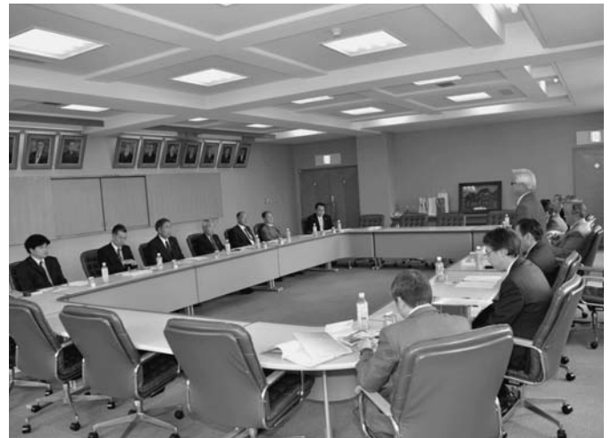
5/25 千葉県、酒々井町(しすいまち)の越川町議会議長、小坂町長を始めとする7名の皆さんが視察のため陸別町を訪れました。議会活性化の取り組み等について説明を行った後、町内施設を見学しました。