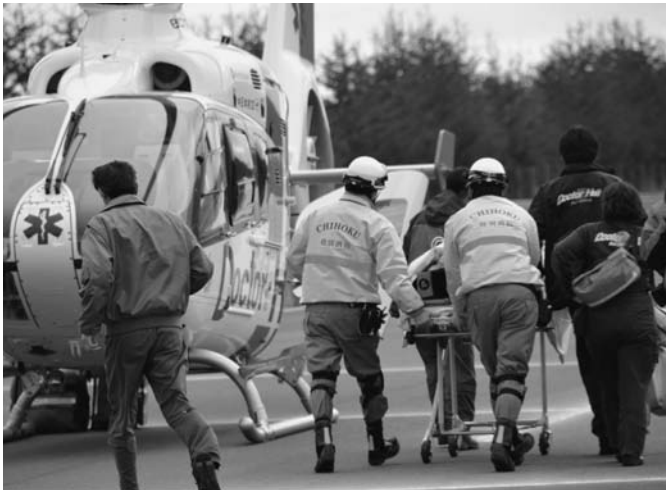
5/13 日産自動車北海道陸別試験場においてドクターヘリを使った訓練が行われました。訓練は、「試験場内での事故によりヘリの出動を要請する」という想定で、実際に釧路からドクターヘリが飛来しました。