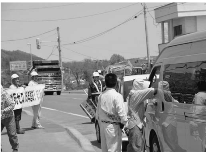
5/31 (株)石橋建設は、7月からの全国安全週間に前に交通安全キャンペーンを行い、「交通事故死ゼロ15年達成まであと46日」の横断幕を作成して、社員16名が通行する車両に交通安全を呼びかけました。