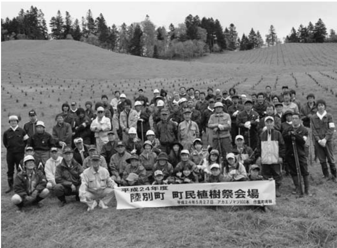
5/27 今年度の町民植樹祭が、作集町有林で行われました。関係機関、林業関係者や一般町民の子供から大人まで参加者84名が参加してアカエゾマツの苗木800本を約1時間かけて植えました。