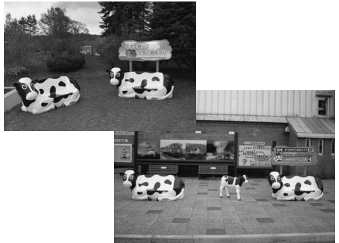
5/25 道の駅と保健センター前庭にホルスタインのベンチが登場しました。これは、中山間直接支払制度陸別集落から牛乳消費拡大のPRを兼ねて休憩用に贈呈されたものです。