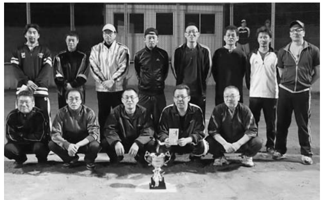
写真は、優勝したシャイアンの皆さんです。