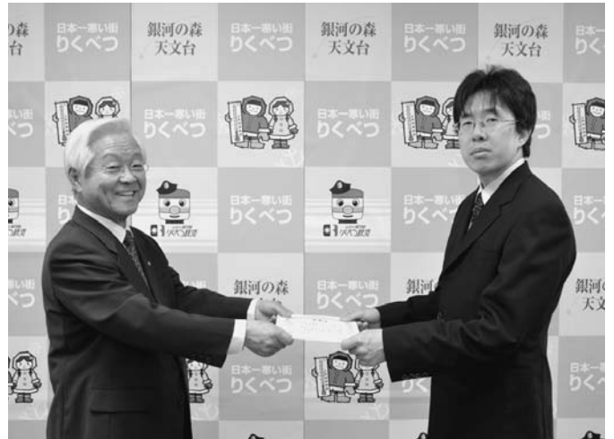
5/2 新栄緑化㈱が4月19日から20日の2日間にわたり行った、町道墓参道の道路清掃の地域貢献に対し、町から感謝状が贈呈されました。