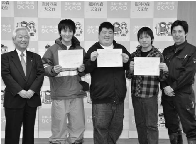
吉本興業㈱が行うプロジェクトで、約1ヶ月間陸別に住みしばれフェスの準備に参加する、札幌吉本所属の「クマッパ」と「タ立」の3人に1月10日町から特別住民票が交付されました。