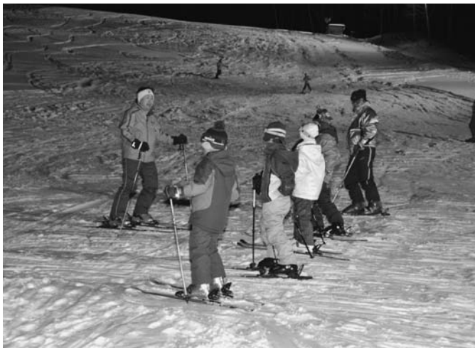
1月17日から19日の3日間、12名が参加してナイトスキー教室が行われました。今年はジュニアバジテストを行い、挑戦した児童9名全員が合格しました。