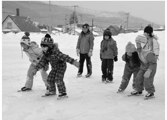
5歳児と小学1年生を対象としたスケート教室が1月5日から7日までの3日間行われ、参加した12名はスケートの楽しさを体験しました。