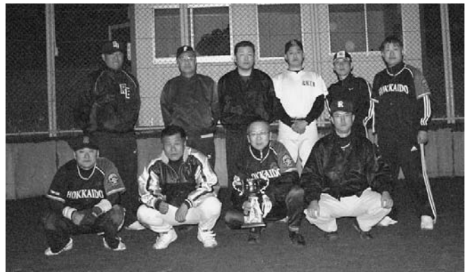
写真は優勝したファイターズチームのみなさんです。