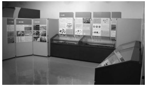
公民館の展示風景

遺物の展示は公民館となります。また、昨年の文化祭で予告し、今年4月に広報でご案内した「史跡ユクエピラチャシ跡写真コンテスト」の要項を班回覧でまわしています(左はその要約です)。これから紅葉の季節にかけて「白いチャシ」が最も美しくなる時期ですので、ぜひカメラを持って史跡へと足を運んでみてください。 (天鳥居仁・教育委員会主任)