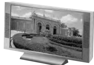
地上デジタル放送対応テレビ