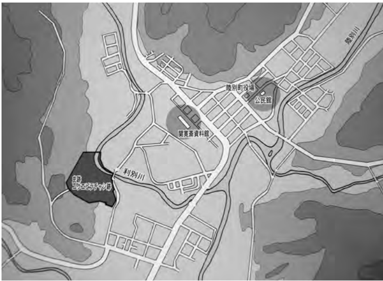
写真 ガイダンスシステム配置図