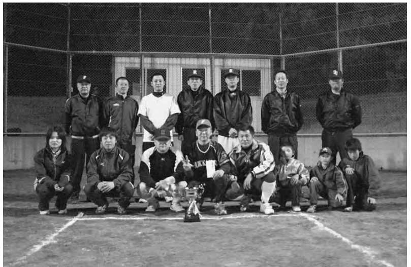
写真は優勝したファイターズチームのみなさんです。