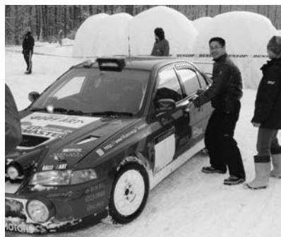
会場内では色々な催しが行われていました。