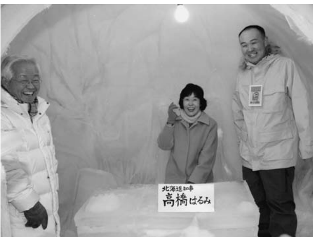
←「高橋はるみルーム」と名付けられた氷の知事室

真冬の夜空を彩るしばれ花火も、約1,500発が打ち上げられ会場を照らし出しました。