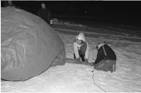
↑バルーンマンション作りを体験