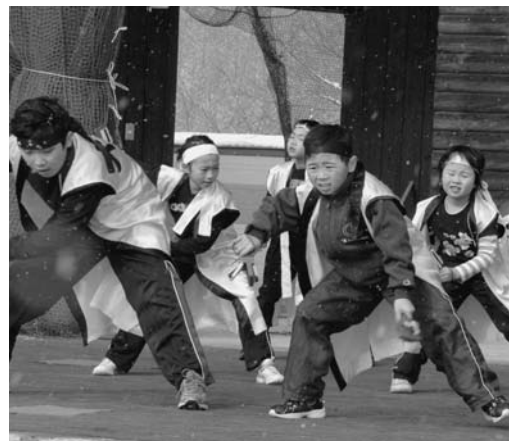
大誉地小学校の児童もよさこいを披露

冬の寒さを逆手にとったこの祭りも28年。今年は名物のひとつ「人間耐寒テスト」に過去最高の241人が挑戦し、寒さを味わいました。8日朝の気温は約マイナス6度と少し物足りない寒さでしたが、参加者全員「認定証」を手にしました。