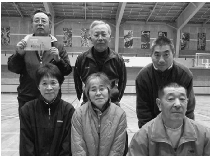
フロアーリング優勝 新町1区チーム