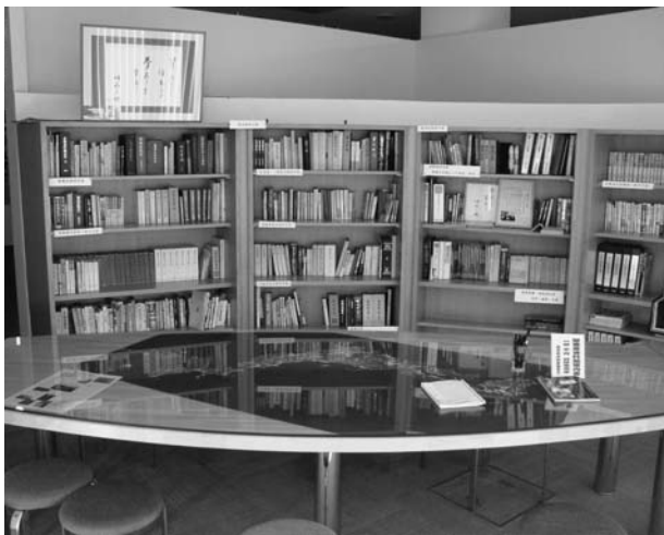
閑寛齋資料館の展示計画箇所（資料コーナー）

われないうこととなりました。その代わりにガイダンスシステムと称して町内の既存施設を使って、遺跡の説明や出土遺物の展示を行うことになっています。