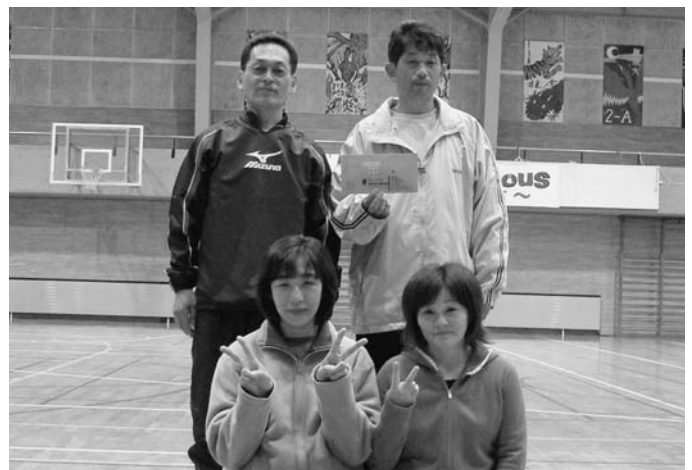
ミニバレー(混成40歳以上)優勝 共栄第2チーム