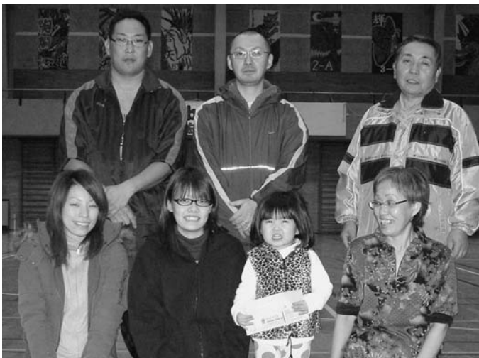
バドミントン優勝 共栄第2チーム