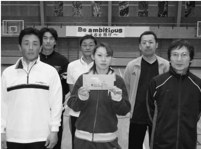
バレーボール優勝 共栄第1チーム