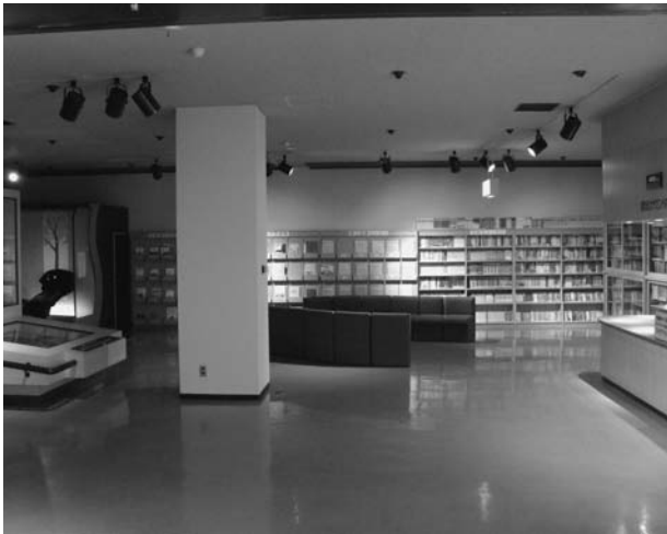
公民館の展示計画箇所（1F視聴覚室）