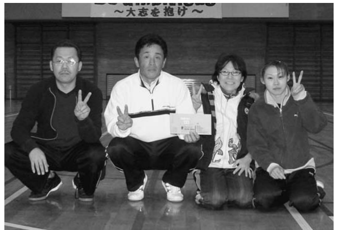
ミニバレー(混成40歳未満)優勝 共栄第1チーム

ミニバレー 優勝 共栄第2 (混成40歳以上) 準優勝 若葉町 第3位 新町2区