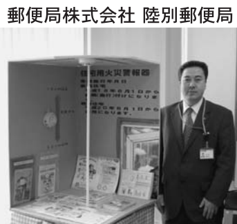
郵便局株式会社 陸別郵便局