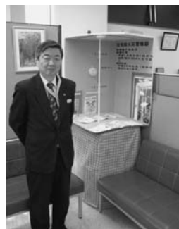
帯広信用金庫 陸別支店