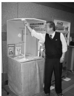
陸別町農業協同組合