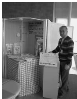
陸別町関寛斎国保診療所