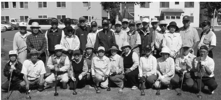
昨年のパークゴルフ大会参加者