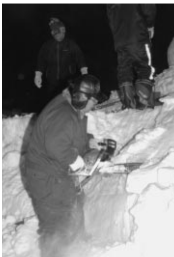
作業は深夜まで続く

「しばれ」当日は、ほとんどの実行委員が運営にあたり、約1カ月にわたり自分たちが準備したその成果を、来場者の数によって確かめる。