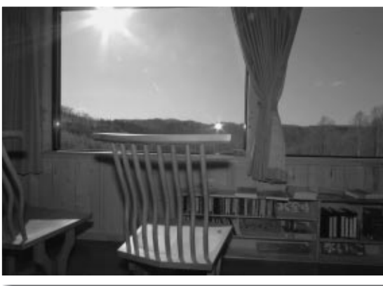
広い窓からは銀河の森を一望できる